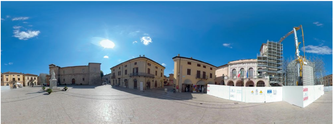
Figura 1. Esempio d'immagine sferica in proiezione equirettangolare. Piazza del Duomo, Norcia (luglio 2018).

di camere grazie alla creazione di appositi supporti; molto spesso le camere utilizzate per tale scopo rientrano nella categoria delle action cam , grazie alle loro caratteristiche e al costo relativamente ridotto. Queste soluzioni sono state le prime a essere disponibili sul mercato e proprio per la loro intrinseca natura presentano diversi vantaggi, in particolare una più ampia possibilità di personalizzazione dei processi di stitching ed un maggior controllo da parte dell'utente nei software dedicati. D'altra parte, esse si configurano inoltre come sistemi meno stabili e meno affidabili rispetto a quelli commerciali. In maniera antitetica, i sistemi COTS garantiscono una maggiore affidabilità e in generale una maggior facilità di utilizzo da parte degli operatori, al prezzo però di rinunciare ad un maggior controllo da parte dell'utente sulle diverse fasi del processo di acquisizione ed elaborazione delle immagini. È inoltre interessante analizzare l'andamento del prezzo di tali sistemi durante gli ultimi anni: esso è infatti andato incontro ad una progressiva e costante riduzione dei costi, facilitando la diffusione di questa tipologia di camere in svariati settori.