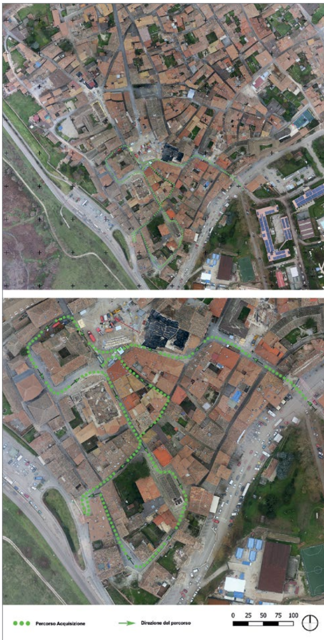
Figura 4. Il percorso effettuato a Norcia utilizzando il sistema Freedom 360.

Nei test portati a termine a Norcia si è deciso di sfruttare al massimo le possibilità connesse alla rapidità di tali sistemi e per tale motivo si è deciso di acquisire sul campo video e non singole immagini panoramiche. Inoltre, il sistema Freedom 360 è stato montato su di un supporto estensibile fissato su di uno zaino rigido, in modo da lasciare l'operatore libero di muoversi e agire sul campo.