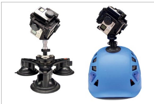
Figura 2. Alcuni dei supporti che possono essere utilizzati per la movimentazione del sistema Freedom 360 durante le fasi d'acquisizione.

vantaggio connesso all'utilizzo di tali sistemi risiede inoltre nella versatilità dei dati acquisiti, che oltre all'utilizzo in ambiti connessi alla geomatica possono essere trattati per altre finalità a supporto delle operazioni sul campo. I dati raccolti possono infatti essere trasformati in video 360 e tour virtuali che possono essere facilmente condivisi tra i diversi enti impegnati sul campo, garantendo lo scambio d'informazioni preziose anche con le persone non presenti fisicamente sui luoghi dell'emergenza. Tali approcci presentano ovviamente anche delle criticità, soprattutto legate alla necessità di sviluppo di ricerche applicate e al fatto che diverse problematiche connesse al loro utilizzo siano ancora oggetto di sperimentazioni.