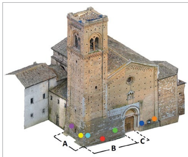
Figura 2. Modello fotogrammetrico 3D, sul quale sono evidenziate la distribuzione spaziale delle distanze utilizzate per scalare il modello fotogrammetrico (a, b e c) e dei punti di verifica utilizzati per l'analisi dei residui dopo l'allineamento della nuvola fotogrammetrica con la nuvola TLS.

Seguendo il tradizionale workflow fotogrammetrico, si è proceduto inizialmente all'orientamento dei fotogrammi e alla generazione della nuvola sparsa di punti, e