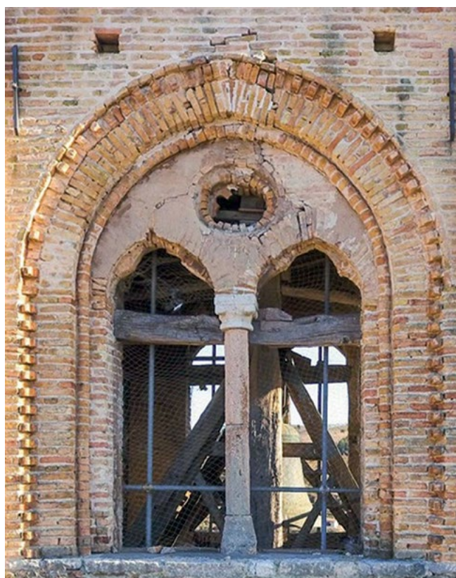
Figura 3. L'apertura bifora oggetto del rilievo. Immagine acquisita da drone.

al dimensionamento delle opere provvisorie. Questo risultato è molto apprezzabile se consideriamo che la parte di modello analizzata è posizionata sul campanile, a un'altezza di 20 m da terra, cioè in una posizione piuttosto distante dai riferimenti utilizzati per l'assegnazione della scala.