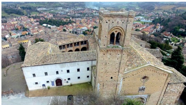
Figura 1. Il duomo Vecchio di San Severino Marche (ripresa da drone).

modalità diretta, misurate ai piedi del manufatto rilevato. Il motivo alla base di questa scelta metodologica è legato alla volontà di fornire, nell'ambito di una collaborazione attivata con il CNVVF (Corpo Nazionale dei Vigili del Fuoco), un metodo operativo, applicabile senza oneri economici nell'acquisto di ulteriore strumentazione di rilievo.