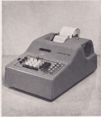
Electric calculator, Olivetti.