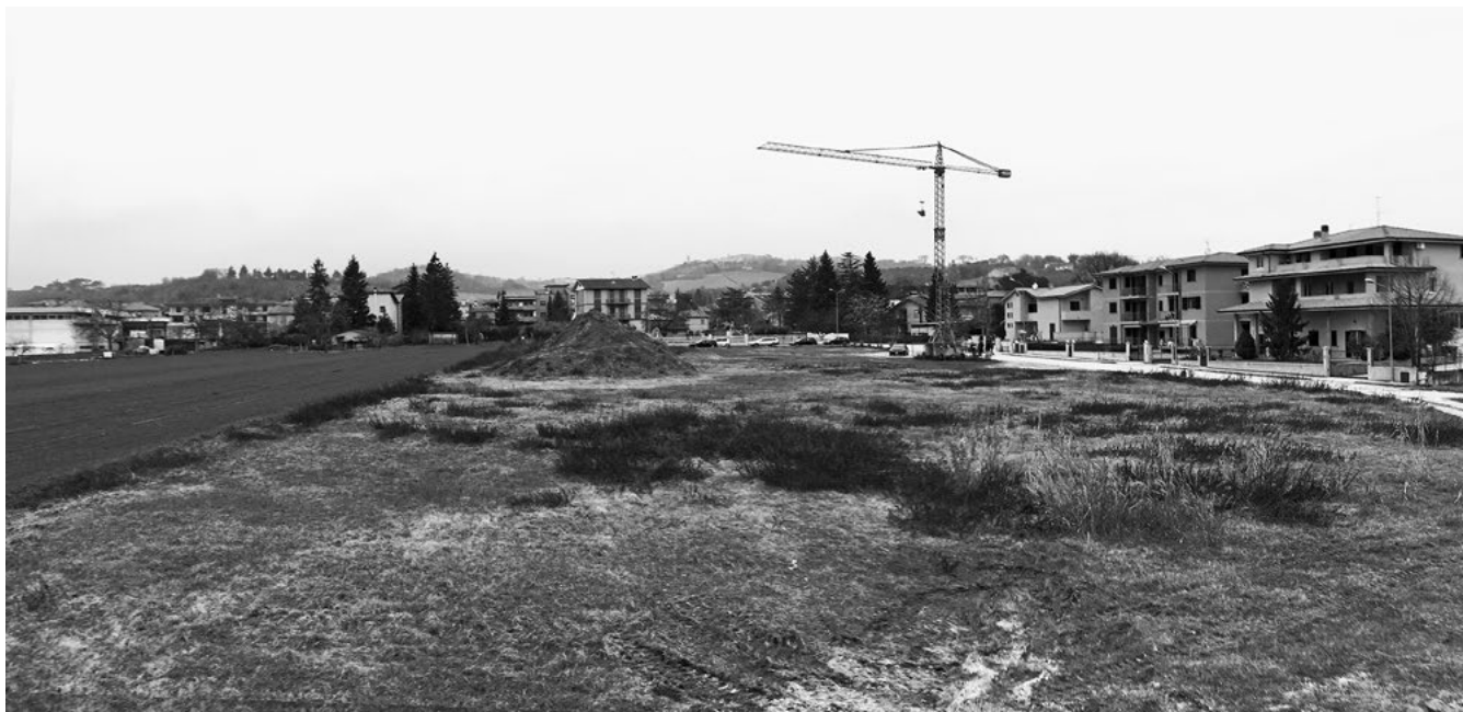
Figura 1. L'area a Piane di Falerone (FM) individuata per la realizzazione della nuova scuola media Don Bosco a Falerone.

L'impianto distributivo per aggregazione di elementi base del progetto mira a tradurre le scelte di organizzazione del programma in una sequenza di spazi sotto il profilo funzionale.