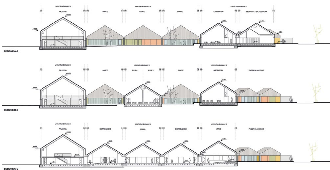
Figura 5. Sezioni longitudinali. Il rapporto tra spazi interni ed esterni e il sistema distributivo della socialità.

tal senso gli spazi serventi – immaginati come ambienti interni da vivere, non solo come semplici corridoi – oltre a garantire l'accessibilità alle unità funzionali, sono concepiti dal progetto come luoghi privilegiati della socializzazione, dell'incontro e dell'inclusione degli utenti.