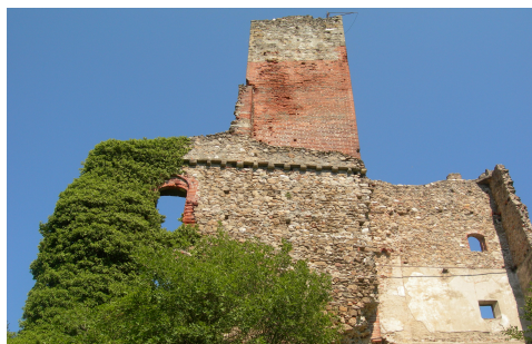
Fig. 5. Nucetto (CN): le rovine del castello con le varie fasi di ampliamento della struttura fortificata.

complesso e come documento delle tracce sismiche del territorio, pensando, invece, di ricostruire le porzioni di muratura collassate necessarie al ripristino strutturale delle cortine più a rischio. Un ruolo importante hanno poi avuto gli studi per la pubblicizzazione in itinere sia delle fasi conoscitive, sia di quelle esecutive; una sorta di live restoration , con la finalità di rendere partecipe il pubblico (dagli esperti ai non addetti ai lavori) non solo rispetto alle indagini storiche, ma anche rispetto alle scelte metodologiche adottate. Ciò attraverso incontri con i rappresentanti delle amministrazioni locali, con i responsabili delle associazioni culturali e con la popolazione (Rudiero, 2013).