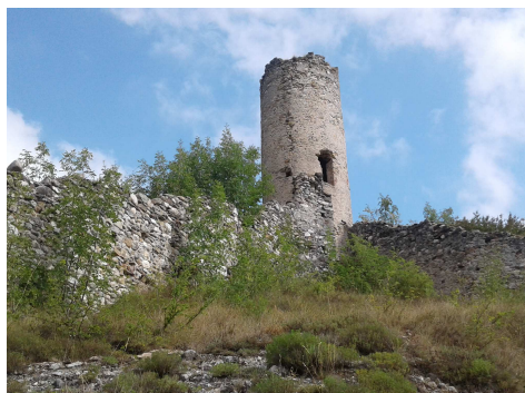
Fig. 1. Bagnasco (CN): i ruderi della cinta muraria con una delle torri di avvistamento.

una rovina nel paesaggio], è un tesoro che la collettività deve gelosamente preservare a ogni costo" (Ordine, 2013). Attualmente, come è noto, l'evoluzione del concetto di paesaggio ha dato vita ad un processo che considera non solo il valore materiale di tale patrimonio, ma anche quello immateriale, legato strettamente alle tradizioni delle popolazioni autoctone, inserendo in tale processo di valorizzazione anche il "valore della rovina" (Scazzosi, 2002). In effetti, da un lato, quest'ultima potrebbe rappresentare utile risorsa aggiuntiva del paesaggio, con tutti i rimandi ai valori culturali che essa possiede; dall'altro, il paesaggio aumenta di valore grazie alla memoria storica espressa dal rudere. Tuttavia il territorio antropizzato continua ad essere considerato come utile scenario per lo sviluppo industriale e per le politiche economiche di molte amministrazioni pubbliche, italiane ed europee.