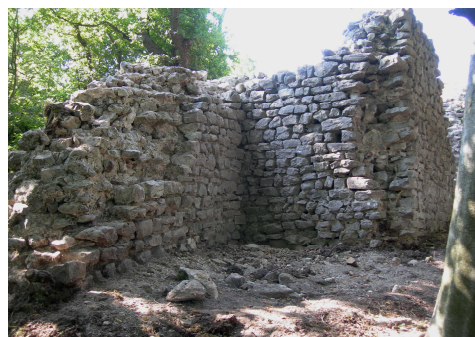
Fig. 3. Bagnasco (CN): la torre del sistema difensivo di Santa Giulitta durante i lavori di pulitura archeologica.

e personaggi che a queste architetture furono legati; lo stretto rapporto tra paesaggio e rovine, che oggi rappresenta una risorsa per il territorio; la volontà degli enti locali di migliorare la conoscenza, la tutela e la valorizzazione di tale patrimonio; la necessità di approfondire problematiche teorico-metodologiche utili al restauro e alla manutenzione di un patrimonio diffuso sempre più vulnerabile. Lo studio, avvalendosi di contributi interdisciplinari, ha utilizzato strumentazioni innovative per il rilevamento e il monitoraggio di tali beni, nonché tecniche di restituzione grafica e digitale per proporre alla comunità scientifica, e comunicare alla popolazione autoctona, gli interventi di restauro, la conservazione, la valorizzazione e la gestione di questo patrimonio culturale.