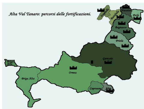
Fig. 2. Mappa dei castelli situati in Val Tanaro (CN).

Il patrimonio architettonico e paesaggistico legato ai sistemi fortificati presenti in tutte le regioni italiane è sempre stato oggetto di attenzione da parte di chi, a vario titolo, si è interessato di salvaguardia, sia dei beni culturali –nell’accezione più generale del termine– sia dei più specifici valori di memoria legati allo sviluppo di quell’aristocrazia che, attraverso il presidio del territorio, ha rafforzato, dal Medioevo sino all’età contemporanea, il proprio predominio politico, sociale, economico.