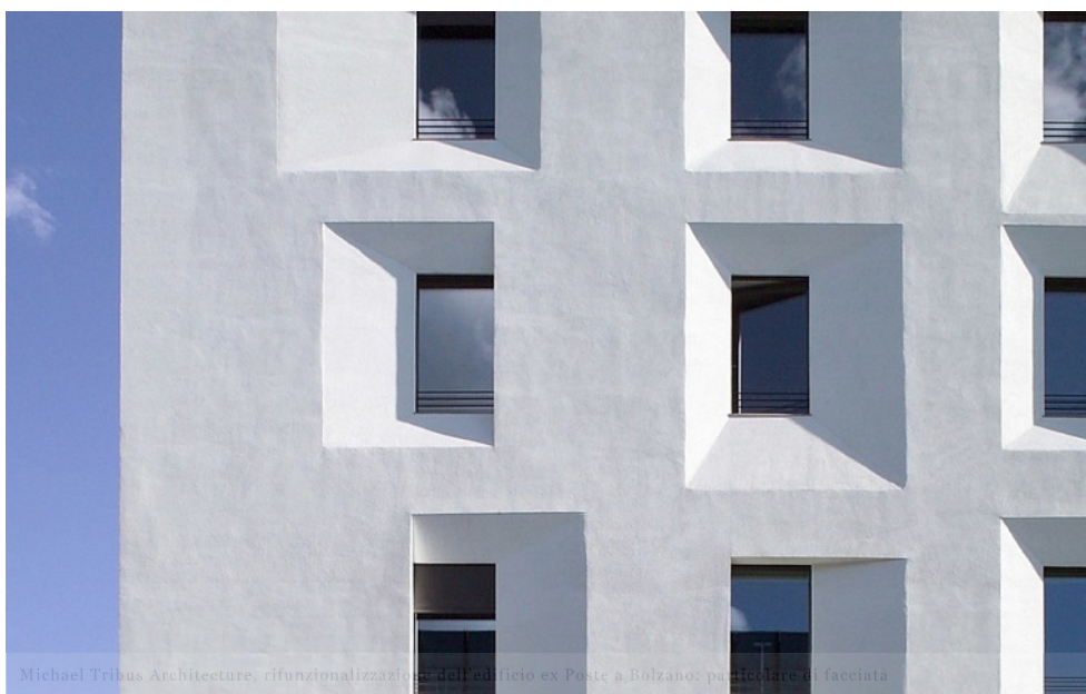
Michael Tribus Architecture, rifunionalizzazione dell'edificio ex Poste a Bolzano: particolare di facciata