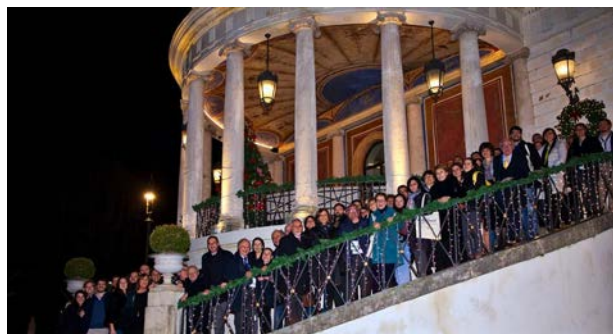
Foto di gruppo alla cena di gala tenutasi alla Casina Valadier

In un'atmosfera pienamente prenatalizia, i partecipanti all'evento si sono infine ritrovati alla cena sociale, un evento di marcata eleganza presso la Casina Valadier, incantevole villa realizzata dal noto architetto Valadier immersa nei giardini del Pincio. La cena con vista su una