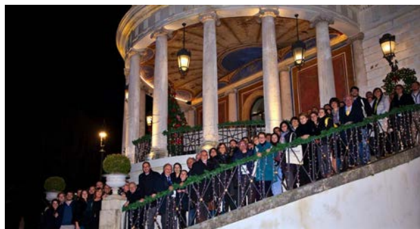
Foto di gruppo alla cena di gala tenutasi alla Casina Valadier

In un'atmosfera pienamente prenatalizia, i partecipanti all'evento si sono infine ritrovati alla cena sociale, un evento di marcata eleganza presso la Casina Valadier, incantevole villa realizzata dal noto architetto Valadier immersa nei giardini del Pincio. La cena con vista su una