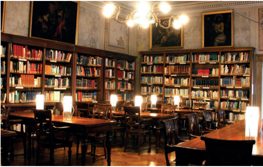
La Biblioteca Querini Stampalia

sentivano fortunati quando riuscivano a catturare una manciata di pesciolini in acque da cui un tempo le loro barche tornavano sempre cariche.