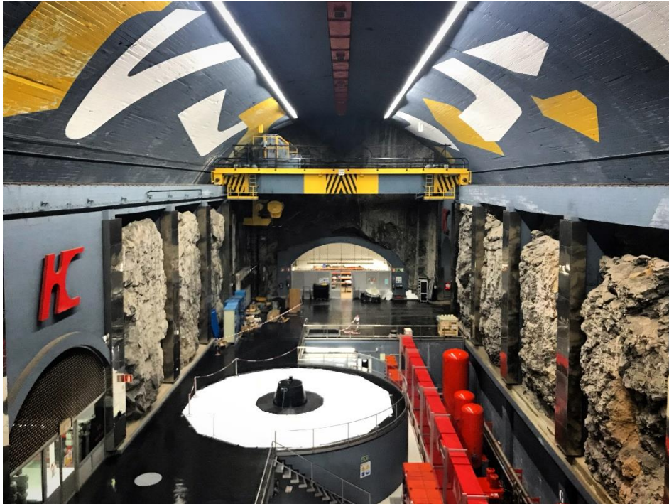
Figura 4. Central hidroeléctrica de Tanes.

en el río Stura en Demonte, Cuneo (1953) o las realizadas en la década de 1930 por Piero Portaluppi, denominado por muchos estudiosos como “maestro dell’architettura elettrica” 8 en la Val d’Ossola (Aosta, Italia). En España, serán las centrales diseñadas por el arquitecto Joaquín Vaquero Palacios en Asturias para la Sociedad Hidroeléctrica del Cantábrico los más famosos ejemplos de diseño de centrales hidroeléctricas en las que técnica, arquitectura y arte se reunirán en importantísimas obras como las centrales de Salime (1945), Proaza (1964) y Tanes (1970) 9 , de los que sin embargo encontramos escasísimas referencias en prensa.