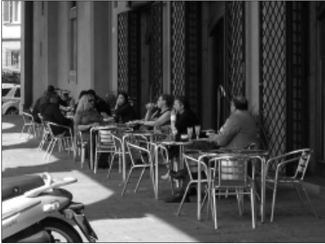
Fig. 1 – Esempi di dehors presenti nella città di Firenze