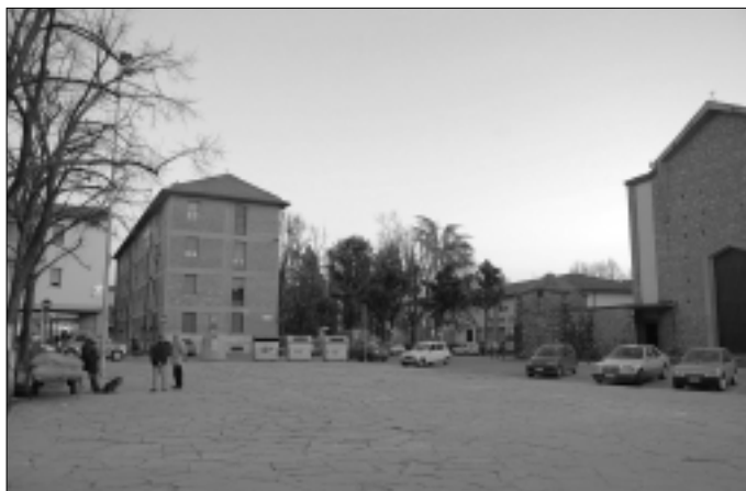
Fig. 3 – Il confronto tra la vivacità di una piazza di fatto (foto sopra: viale dei Bambini) e la desolazione della piazza progettata (foto a destra: piazza dell'Isolotto)