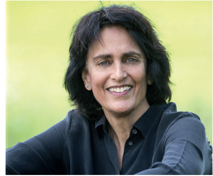
La scrittrice Sue Halpern

La quindicenne Sunny arriva in biblioteca quasi all’inizio della storia, presentandosi il primo giorno con una “maglietta maschile bianca con un grande punto interrogativo disegnato con il pennarello nero sul davanti” e spiegando che “aveva fatto la maglietta pensando alla gente che entrava in biblioteca e magari aveva qualche domanda”. Ci arriva per scontare una condanna del tribunale minorile per un furto decisamente anomalo: è stata colta in flagrante mentre tentava di rubare un dizionario nella libreria del centro commerciale. Al giudice del tribunale che le chiede perché volesse rubare il Dizionario Universitario Merriam-Webster , Sunny candidamente risponde che non aveva abbastanza soldi per comprarlo e aggiunge: “in realtà avrei potuto permettermi l’edizione tascabile, ma i tascabili non durano. Le pagine si staccano, e a cosa serve un dizionario se gli manca qua e là qualche pagina? Vai a cercare una parola che non c’è e non puoi nemmeno provare che ci fosse. L’edizione