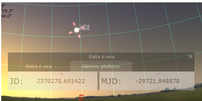
Fig.2: Il 2 Luglio 1777, Padova.

Poi abbiamo "Josephus TOALDI et Vincentius CHIMINELLI, Immersio Veneris sub Luna, 2. Jul. 1777. Saggi di Padoua. T. 1. p. 280 (Figura 2).