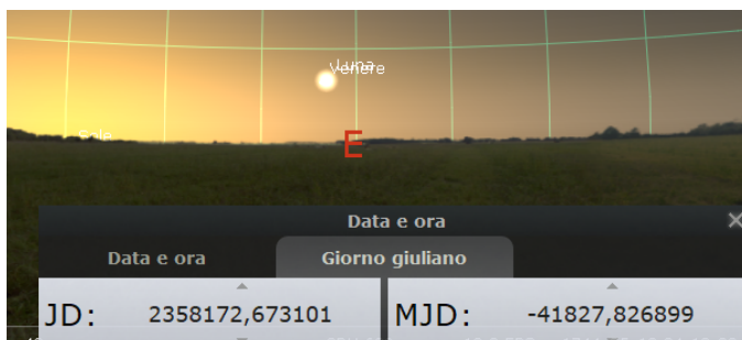
Fig.1: Ecco il 10 Maggio 1744, da Parigi.

"Nicolas Louis DE LA CAILLE. Occultation de Venus per la lune, observée le 10. May 1744. Mem. de l'Acad. des Sc. de Paris, A. 1744. Mem. p. 113. Ed. Oct. A. 174. Mem. p. 160. Ed ecco come appare in Stellarium, osservata da Parigi (Fig.1.)