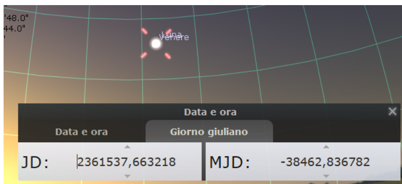
Fig.3: L'immagine è la simulazione da Leida al 27 Luglio 1753.

Johann LULOFS. Waarneeming der bedecking van Venus door de maan, d. 27. July 1753 gedaan te Leyden. Verhandel. van het Maatsch. te Haarlem. Deel. 1. Bl. 382 (Figura 3).