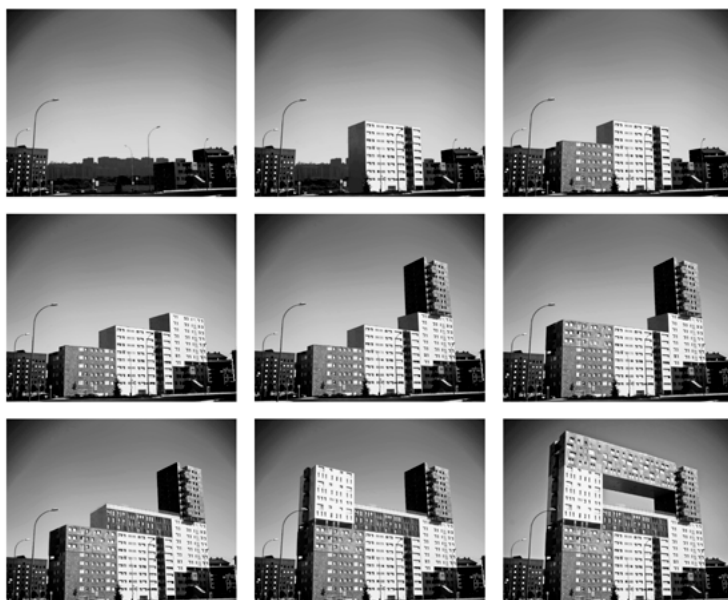
Boule de neige. Elaborazione grafica del processo progettuale dell'edificio Mirador. La delimitazione del reale operata dall'algoritmo è l'espedito che permette la rappresentazione dell'edificio in termini di volumi successivamente accostati e sovrapposti. (Foto-elaborazione dell'autore. Fotografia originale: Alexander Stübner. CC BY-SA 4.0 — https://creativecommons.org/licenses/by-sa/4.0/ )

Rappresentazione schematica di un algoritmo applicato al progetto di architettura. L'algoritmo delineato è un'interpretazione del processo progettuale dell'edificio Mirador dello studio MVRDV (Sancharro, Madrid, Spain, 2001-2005) ed evidenzia alcuni possibili interventi del progettista, i quali distinguono il processo dalla sola reiterazione automatica delle operazioni, condizionando l'impiego degli output intermedi e i risultati finali.