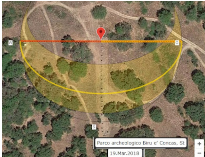
Fig.3: Ecco un notevole allineamento di 20 menhir. Seguono la direzione cardinale Nord-Sud. In figura si vedono le direzioni del sorgere del sole e del suo tramonto all'equinozio, secondo un orizzonte astronomico. L'allineamento dei menhir è perfettamente coincidente con la direzione meridiana.

Le Figure 3 e 4 mostrano due allineamenti di menhir a Biru e Concas visibili con le immagini satellitari di Google Earth.