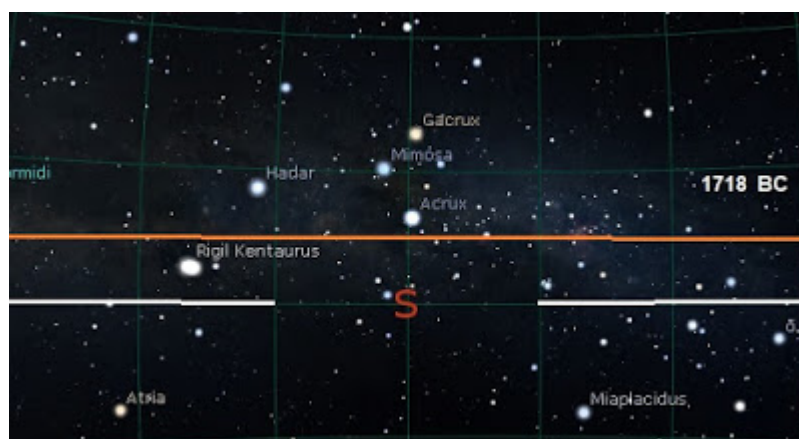
Fig.6: Per effetto della precessione dell'asse terrestre, attorno al 1700 BC, le stelle della Croce sono più basse sull'orizzonte naturale.