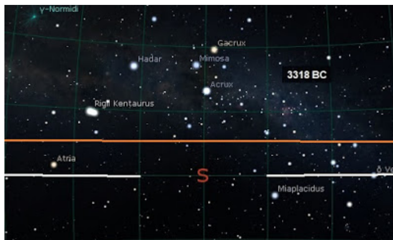
Fig.5: Ecco le stelle che si potevano vedere guardando l'orizzonte verso Sud attorno al 3300 BC. Sopra l'orizzonte naturale, rappresentato approssimativamente dalla linea arancione, splende la Via Lattea con la Croce del Sud. Anche Alpha Centauri (Rigil Kentaurus) è visibile. La linea bianca rappresenta invece l'orizzonte astronomico.

Se guardiamo verso Sud, utilizzando Google Earth e il suo strumento che permette di avere il profilo locale di elevazione, vediamo che l'orizzonte naturale si eleva di circa 4 o 5 gradi sopra l'orizzonte astronomico. Tenendo presente questo dato, utilizziamo il software Stellarium che ci permette di simulare il cielo antico (per altri esempi di simulazioni con Stellarium si vedano [6-9]). Simuliamo al 3300 BC ed al 1700 BC (probabile inizio e fine dell'utilizzo del sito di Biru 'e Concas). I risultati sono dati nelle Figure 5 e 6.