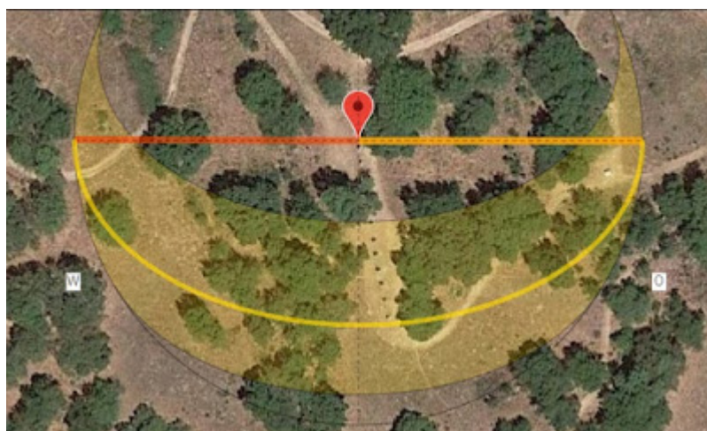
Fig.4: Un altro allineamento di menhir (deviazione di circa 10 gradi dalla direzione cardinale verso Sud).