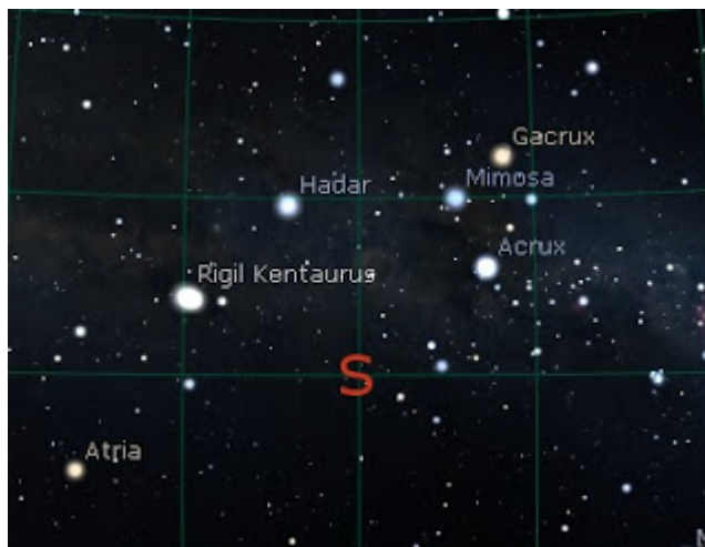
Fig.7. Se l'orizzonte naturale ha un'elevazione, rispetto al punto d'osservazione, di circa 4 gradi, Rigil Kentaurus sorgeva, attorno al 1700 BC, con un azimuth di 10 gradi.

Per effetto della precessione dell'asse terrestre, col passare dei secoli, le stelle della Croce del Sud avevano un'altitudine sull'orizzonte che diventava sempre più bassa. Guardando la Figura 6, ci possiamo chiedere: Rigil Kentaurus era visibile sopra l'orizzonte naturale? Ed eventualmente, in che direzione sorgeva? Proviamo a simulare come si poteva vedere sorgere Rigil Kentaurus dal sito di Sorgono, intorno al 1700 BC.