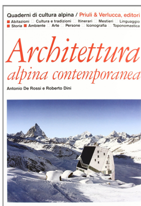
(Fig.1) Antonio De Rossi, Roberto Dini, Architettura alpina contemporanea , Priuli & Verlucca Editore, Scarmagno (TO) 2012

Un affascinante viaggio attraverso le Alpi italiane, francesi, svizzere, austriache e slovene, alla scoperta dei più importanti progetti di architettura alpina degli ultimi 25 anni. Più di 200 opere presentate e illustrate: dai grandi interpreti dell'architettura contemporanea in montagna – Peter Zumthor, Gion A. Caminada, Bearth & Deplazes, Valerio Olgiati, Hermann Kaufmann, Jürg Conzett, Cino Zucchi, Gabetti & Isola –, fino alle molte realizzazioni di qualità di tanti progettisti