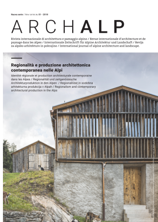
(Fig.4) ArchAlp - rivista internazionale di architettura e paesaggio alpino

Con la fine degli anni settanta del Novecento, il modernismo alpino conoscerà la sua fase discendente, portatrice di una crisi profonda e di una radicale rimodulazione, con l'emergere di nuove sensibilità ambientali e l'avvio di una nuova idea della montagna, che porrà al centro il tema della sua patrimonializzazione, nuovo paradigma sul quale si chiude il volume.