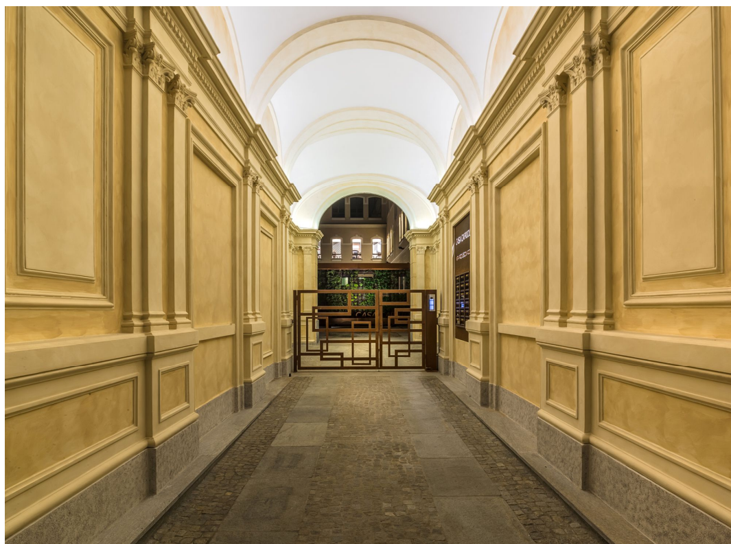
Fig. 1 - Entrance of Casa Capriolo from Via Arcivescovado. In the background the vegetated wall inside the courtyard

work in cities, urban green space is likely to play an increasingly important role in promoting well-being [2]. However, increasing building density means that space for ground-level urban vegetation is becoming rarer [3]. In response, cities are incorporating innovative forms of green space [4], such as green walls, that can be integrated into existing infrastructure.