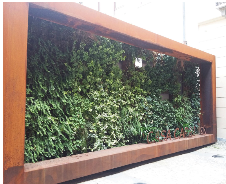
Fig. 5 – On the left, the green wall after installation; on the right, the vegetation growth after one year