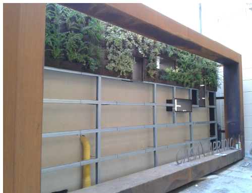
Fig. 4 - On-site assembling stage

On the whole, these features allow about 13 man hours per 21 m 2 of installed wall to be achieved, which is equivalent to the work of 2 installers per day.