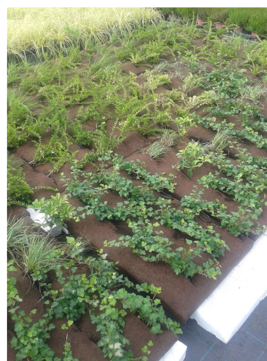
Fig. 3 - On the left, pattern of plant species. On the right, pre-vegetated modules in nursery