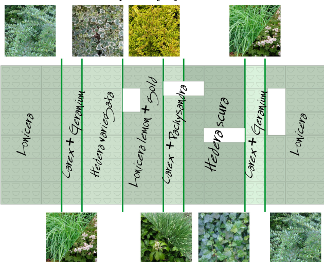
Fig. 3 - On the left, pattern of plant species. On the right, pre-vegetated modules in nursery

The small size of the modules, the reduced weight and the reverse assembling connections have allowed an easy and quick-assembly installation of the wall (Fig. 4).