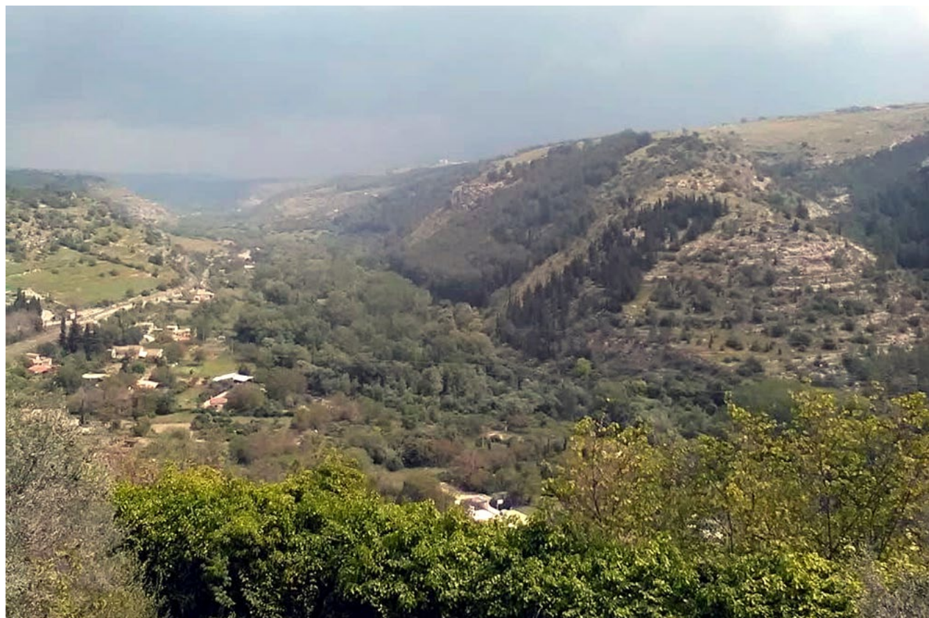
Figura 2. Paesaggio collinare del Ragusano, dove sono ancora visibili terrazzamenti sostenuti da muri a secco, oggi interessati da diffusi fenomeni di rinaturalizzazione.

Il frazionamento del latifondo attuato durante il dominio islamico nel contesto della cosiddetta “rivoluzione agricola” 40 e la creazione di numerose piccole proprietà, grazie anche ad un favorevole regime di tassazione fondiaria, comporta, in un territorio rurale già diffusamente antropizzato, un'ulteriore spinta alla “colonizzazione” delle campagne incolte 41 e alla costruzione, soprattutto nelle aree interne, di casali. Il termine “casale” indica una varietà di tipologie