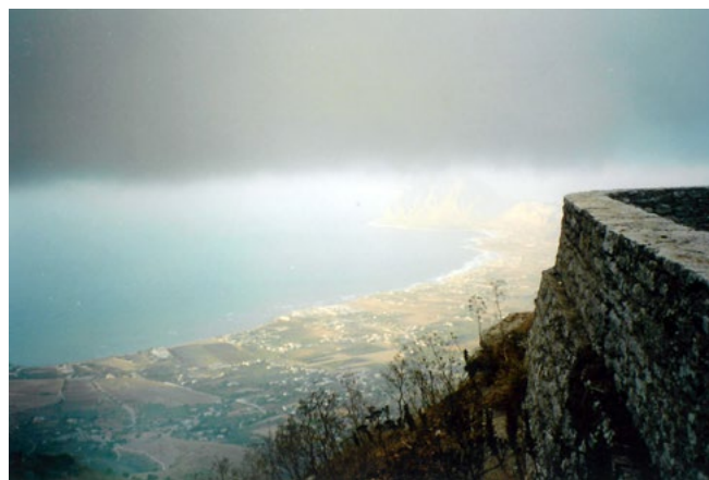
Figura 3. Il Castello di Erice (Provincia di Trapani), edificato in epoca normanna, domina la piana costiera.

Lo sguardo dei geografi si sofferma anche sul paesaggio urbano e in particolare su quello di Palermo. Idrisi ne celebra anzitutto la felice posizione: «Situata sulle rive del mare nel settore occidentale dell'isola, essa è circondata da imponenti e massicce montagne e la sua riviera è amena, soleggiata e ridente» 54 . Fuori le mura «le sue pianure, son tutte un giardino», mentre al suo interno vi è «un tripudio di frutteti» 55 , soprattutto agrumeti (aranci e limoni), diffusi nei giardini urbani e suburbani palermitani a scopo essenzialmente decorativo.