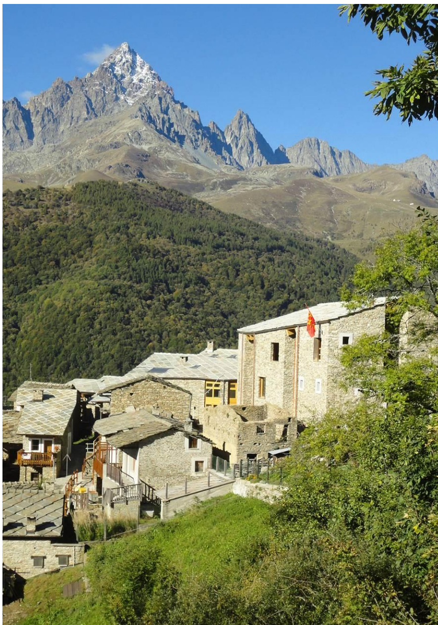
Fig. 1 – Centro culturale Lou Pourtoun, Borgata Sant’Antonio, Ostana, Massimo Crotti, Antonio De Rossi, Marie-Pierre Forsans, Studio GSP, 2016. Progetto selezionato al premio Architetti Arco Alpino 2016.