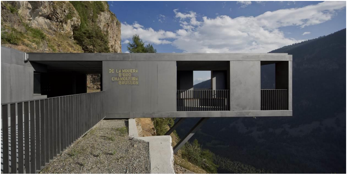
Fig. 2 – Riqualificazione della miniera di Chamousira a Brusson, Corrado Binel, EM2 Architekten, 2015. Progetto selezionato al premio Architetti Arco Alpino 2016.