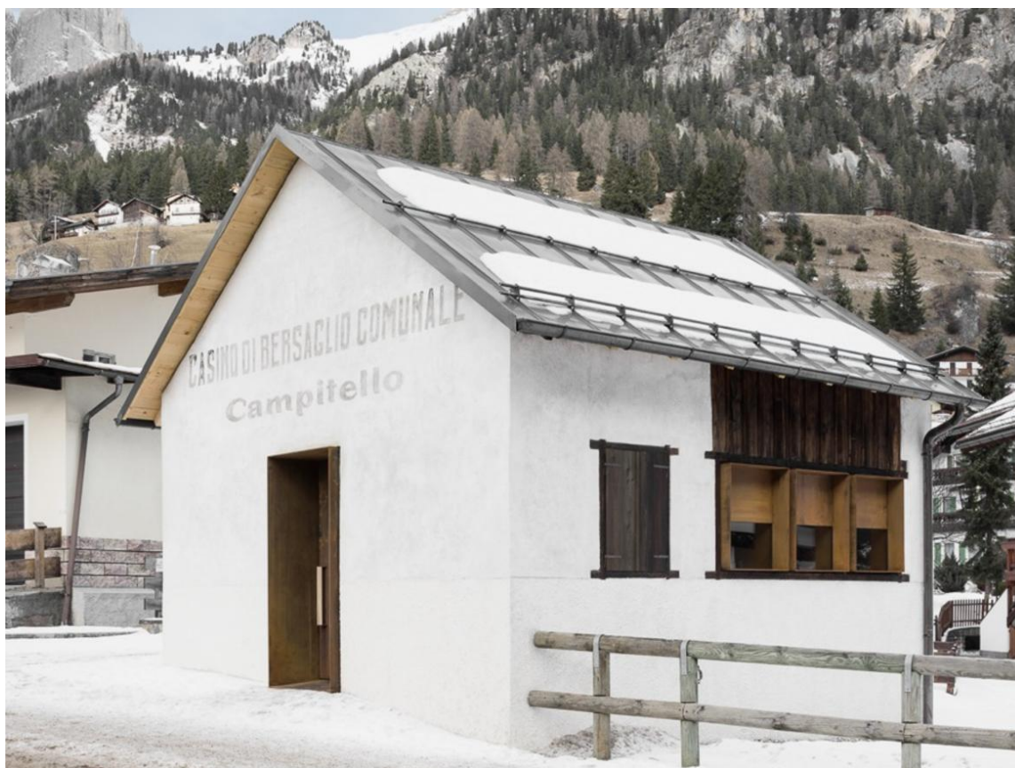
Fig. 5 – Restauro del Casino di Bersaglio Campitello, Campitello di Fassa, Weber+Winterle architetti. Progetto premiato alla rassegna Costruire il Trentino 2013-2016.