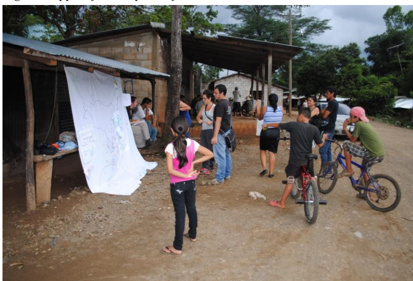
Fig.1 - Mappe informali per l'informazione comunitaria

Fonte: Mappa e fotografia di Cantini, Cristiano, Falchetti, Giosi, Orefice, Vasilescu.