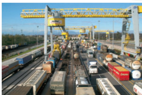
Esempio di binari operativi sotto gru a portale in un terminal intermodale strada-rotaia

Gli spedizionieri effettuano la propria prenotazione, che risulta essere la "pre-fase" per le Unità di Trasporto Intermodali (UTI) che giungeranno al terminal intermodale. Le operazioni principali che si possono identificare