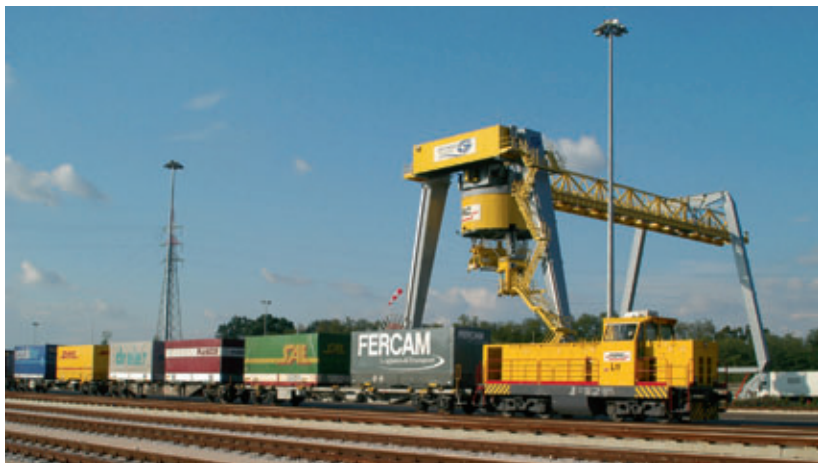
Treno in arrivo al terminal presso i binari del fascio di presa e consegna

Per ciò che riguarda le UTI che effettuano il percorso in import, sono “accolte” dal personale terminalistico, dopo la manovra di introduzione al terminal, con la fase di spunta del treno in arrivo che controlla la coerenza della composizione dello stesso rispetto ai dati contenuti nel siste-