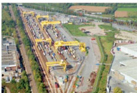
Immagine di parte del terminal di Busto Arsizio Gallarate gestito da Hupac SpA

agevolare l'accessibilità; è raccordato alla rete RFI con la stazione di Gallarate, accesso maggiormente utilizzato, e alla stazione di Busto Arsizio. Per quanto riguarda l'accessibilità stradale, il terminal è ben collegato tramite uno svincolo dedicato della statale dell'Aeroporto di Malpensa, raggiungibile facilmente dai traffici provenienti per esempio dalle zone di Milano, Varese, Brianza e Comasco.