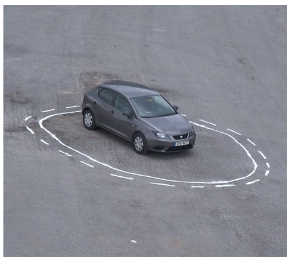
Figura 2. James Bridle, Untitled (Autonomous Trap 001) , Monte Pernaso, Grecia, 2017. Per gentile concessione dell'artista.

In contesti urbani, densamente trafficati e con percorsi pedonali e ciclabili che molto spesso intersecano e/o sono contigui alle carreggiate stradali, la convivenza tra automobili a guida autonoma ed esseri umani diventa particolarmente