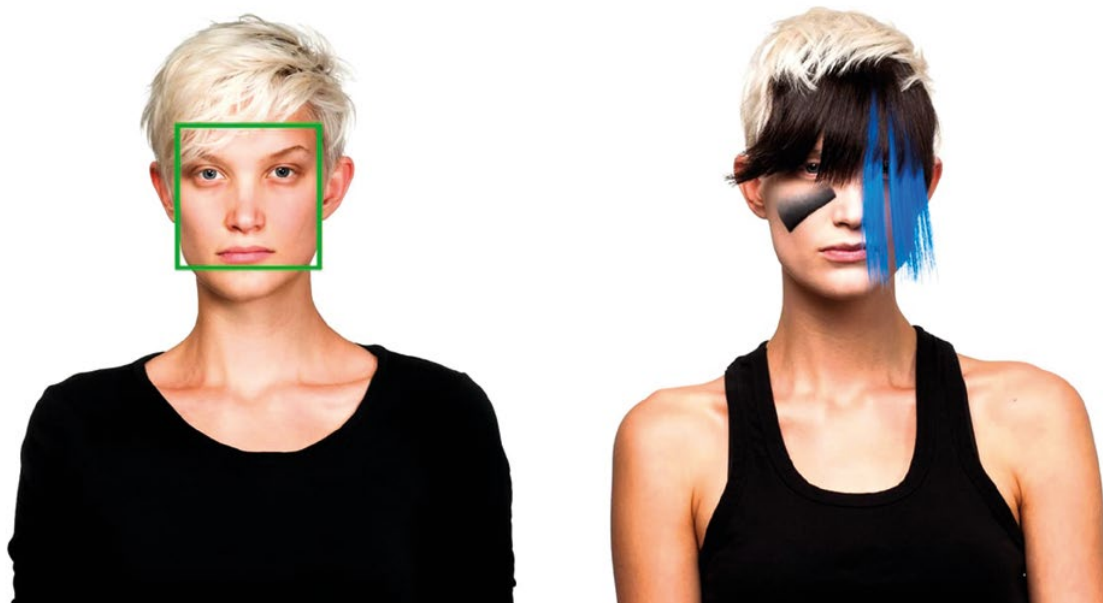
Figura 3. Adam Harvey, CV Dazzle (Look N° 5 per il New York Times Op-Art), 2010. Questo progetto esplora tecniche di camouflage basate esclusivamente sull'utilizzo di particolari acconciature e trucchi che, alterando i tratti tipici di un volto umano, sono in grado di sabotare algoritmi di riconoscimento facciale. Per gentile concessione dell'Artista.

apprendimento automatico supervisionato. Durante la fase di allenamento (in inglese, training ), l'algoritmo apprende, sulla base di un vastissimo campione di immagini pre-etichettate contenenti persone, i pattern visivi distintivi degli esseri umani. In questo modo, l'algoritmo estrae induttivamente una funzione matematica che verrà a seguito utilizzata per discernere ciclisti e pedoni nelle immagini catturate in tempo reale dalle videocamere di bordo. Tuttavia, l'elevata variabilità umana, in termini di posa/apparenza, riduce sensibilmente la capacità dell'algoritmo di generalizzare oltre quanto appreso nella fase di training , e cioè di interpretare con successo immagini a cui non è mai stato esposto prima. Diverse soluzioni sono state finora adottate per ridurre i fattori di incertezza, sia interni che esterni, associati all'utilizzo di automobili a guida autonoma, specialmente considerando che errori a livello di percezione dell'ambiente possono risultare fatali per la vita di persone sia all'interno che all'esterno dell'automobile. Ciò si è generalmente tradotto nell'utilizzo di un numero maggiore di sensori per assicurare ridondanza e ridurre incertezza nell'acquisizione ed elaborazione di dati relativi all'ambiente circostante 27 , a scapito però di un maggiore onere computazionale e tempi di esecuzione più lunghi 28 , nonché costi di produzione (e vendita) proibitivi.