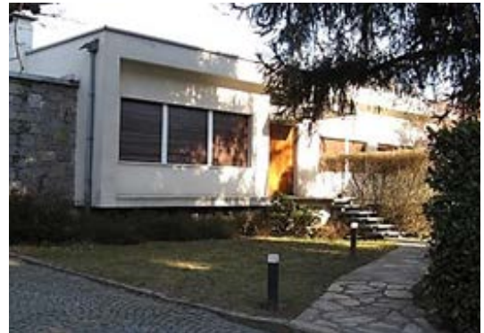
Ville unifamigliari per Dirigenti