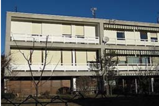
Case per famiglie numerose