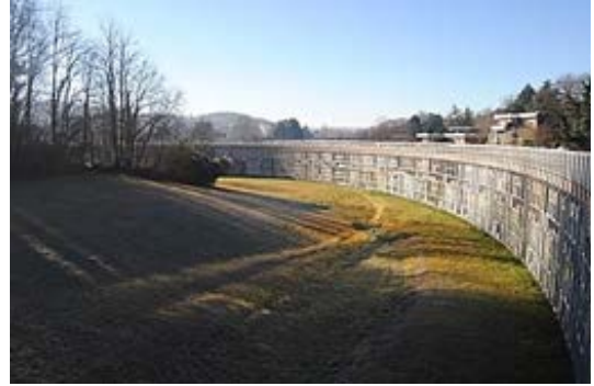
Unità residenziale Ovest