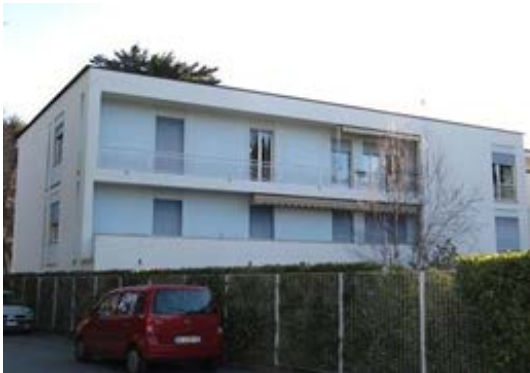
Edifici 4 alloggi