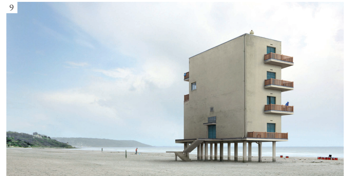
Figura 9 Filip Dujardin, D'ville 005 , 2012. Impresión en chorro de tinta sobre papel perlado, 110x70 cm. Designboom . [consultado el 1 de junio de 2019]. Disponible en: https://www.designboom.com/art/impossible-architecture-by-filip-dujardin/ .

La duración de estas imágenes depende por tanto de lo que dure la reflexión que suscitan, la idea que representan, o el lugar que tratan de comunicar, liberándose cada vez más de la función que una vez tuvieron de documentar y mediar la propia que las produjo.