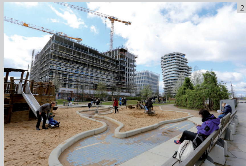
Figure 3 Irene Ruiz Bazán, Hafen City , 2017. Digital photography. Photographic image once the postproduction techniques of light modification are used, explained in which it is possible to see how the image approaches the visual language of the render. © The author.

Figure 2 Irene Ruiz Bazán, Hafen City , 2017. Digital photography. Photographic image before using the light modification postproduction techniques explained. © The author.