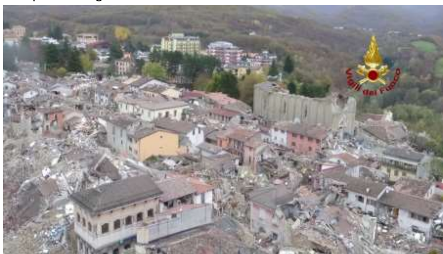
Figura 1 – Ricognizione con drone del centro storico di Amatrice

La flessibilità delle operazioni di volo offerta dai sistemi SAPR rappresenta la caratteristica più innovativa e funzionale all'impiego di tali tecnologie a supporto delle fasi di progettazione, costruzione, gestione e soccorso di strutture e infrastrutture. Grazie all'alta risoluzione delle immagini acquisite, abbinata all'elevata stabilità ed alla possibilità di sorvoli di prossimità, è possibile ottenere un database di immagini la cui completezza e precisione garantisce la coerenza delle elaborazioni successive.