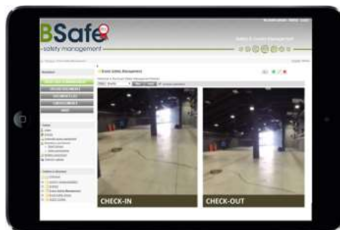
Figura 4 – Sopralluogo di messa a disposizione e riconsegna degli spazi – The Mall, Porta Nuova Garibaldi, Milano

La metodologia adottata è assimilabile ad un sistema di “check-in” e “check-out” nel quale, in contraddittorio, vengono evidenziate sfruttando le funzionalità del SAPR eventuali danneggiamenti pregressi o le possibili anomalie riconducibili all’evento specifico.