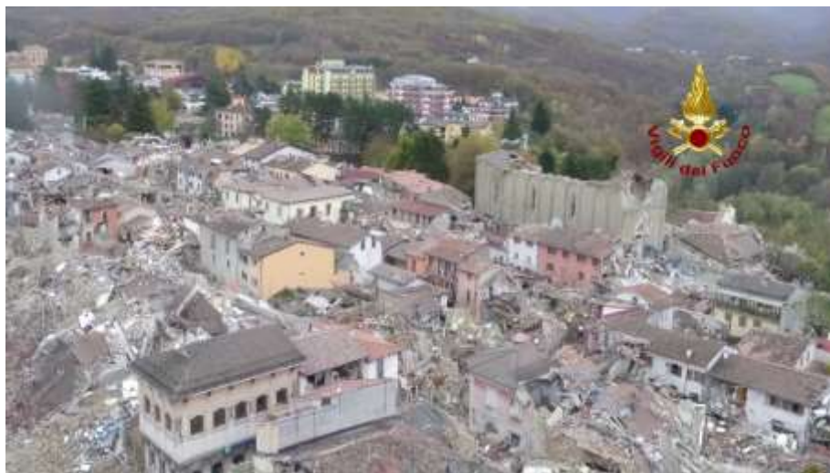
Figura 1 – Ricognizione con drone del centro storico di Amatrice

La flessibilità delle operazioni di volo offerta dai sistemi SAPR rappresenta la caratteristica più innovativa e funzionale all'impiego di tali tecnologie a supporto delle fasi di progettazione, costruzione, gestione e soccorso di strutture e infrastrutture. Grazie all'alta risoluzione delle immagini acquisite, abbinata all'elevata stabilità ed alla possibilità di sorvoli di prossimità, è possibile ottenere un database di immagini la cui completezza e precisione garantisce la coerenza delle elaborazioni successive.