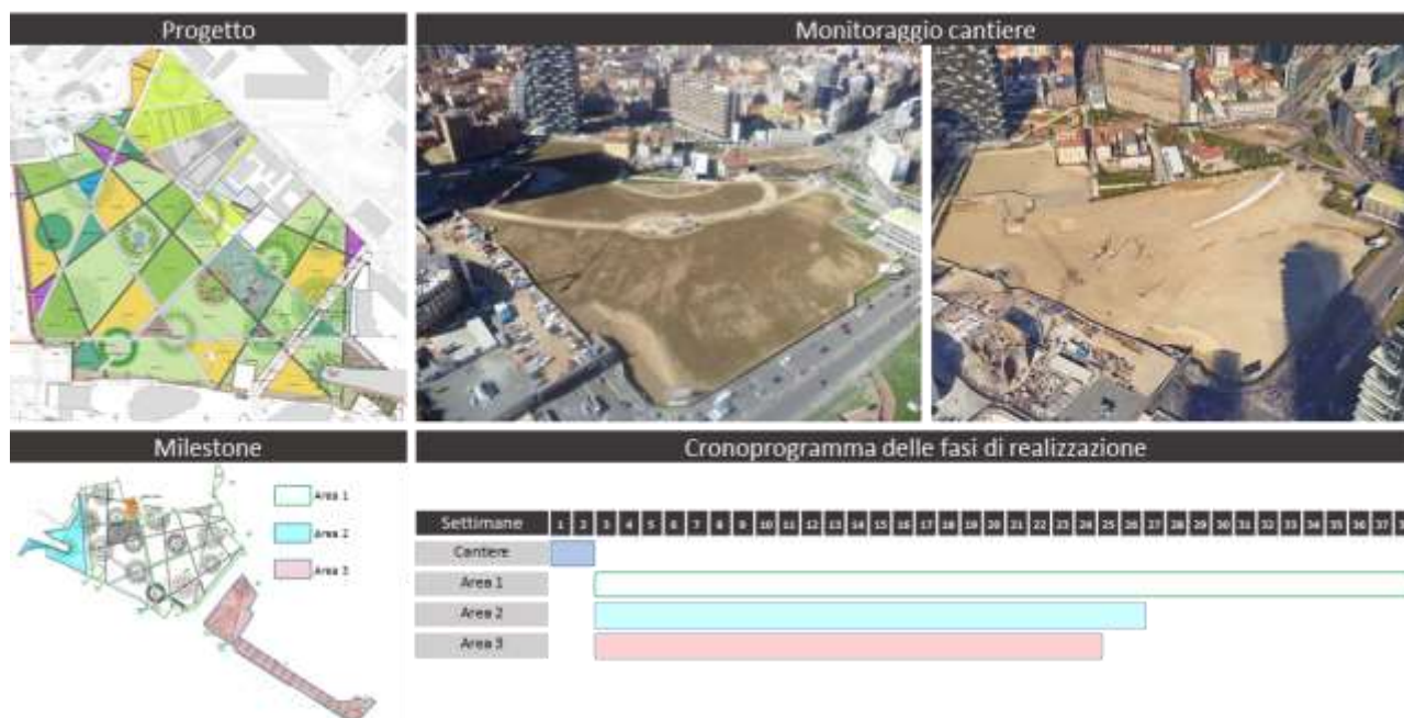
Figura 2 – Monitoraggio attività di cantiere e verificai avanzamento delle fasi di lavorazione all'interno del parco "Biblioteca degli Alberi" – Porta Nuova, Milano

In modo analogo, gli stessi sono stati utilizzabili in cantiere durante la fase di costruzione, concorrendo al monitoraggio delle attività e delle lavorazioni, verificandone efficacemente l'avanzamento e registrando le possibili interferenze ed i rischi ad esse connessi. In tale contesto, l'utilizzo dei SAPR ha supportato l'individuazione dei rischi specifici legati alla non conformità da parte del responsabile della sicurezza, mitigandone gli effetti.