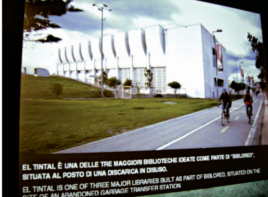
EL TINTAL È UNA DELLE TRE MAGGIORI BIBLIOTECHE IDEATE COME PARTE DI "BIBLORED", SITUATA AL POSTO DI UNA DISCARICA IN DISUSO. EL TINTAL IS ONE OF THREE MAJOR LIBRARIES BUILT AS PART OF BIBLORED, SITUATED ON THE SITE OF AN ABANDONED GARBAGE TRANSFER STATION