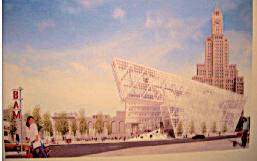
Progetto per la Visual and Performing Arts Library, New York

La Biblioteca El Tintal è parte del programma Biblored, che ha creato una delle reti bibliotecarie pubbliche più utilizzate in America La-