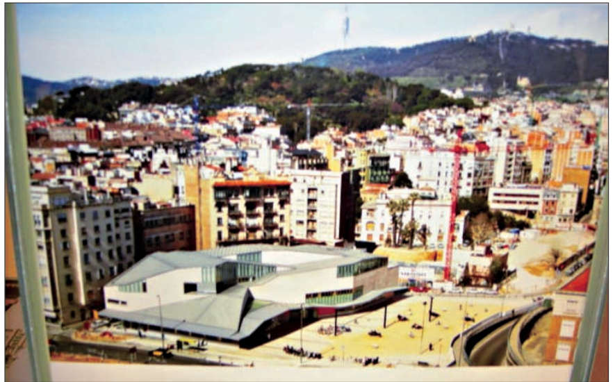
La Biblioteca Jaume Fuster di Barcellona, presentata alla 10. Mostra internazionale di architettura di Venezia

La 10. Mostra internazionale di architettura che si è tenuta a Venezia dal 10 settembre al 19 novembre del 2006 aveva un tema che era senz'altro di interesse per molti, architetti e non. La stessa impostazione della mostra è stata garanzia di un grande riscontro di pubblico, poiché rispetto al passato risultava meno progettuale e più incentrata sui risvolti socioculturali che l'architettura porta sempre con sé. Il tema, e titolo della mostra, era infatti "Città. Architettura e società", e in quanto tale si prestava a una lettura a vari livelli. Il percorso della mostra si dipanava difatti tra città immaginarie e città reali, città del presente e città future, ma sempre collegando in maniera esplicita l'architettura con il contesto sociale e culturale in cui l'architetto si trova a operare, sottolineando chiaramente in ogni padiglione dell'esposizione come la prima non possa e non debba essere scissa dal secondo e come il lavoro dell'architetto possa contribuire a trasformare il territorio, non solo rispetto alle caratteristiche urbanistiche, ma anche rispetto alle abitudini sociali e alla realtà culturale. La tendenza oggi è verso l'urbanizzazione e la città è oggetto di grande attenzione in un'architettura rivolta a promuovere la territorialità, tesa verso la ricerca di uno stretto legame delle opere con il territorio e con l'obiettivo di lavorare a una ricompattazione della città, alla sua rivalutazione come luogo vivibile e sostenibile in cui