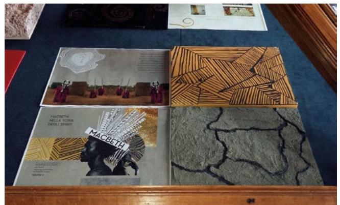
Macbeth, bozzetto Atto II.