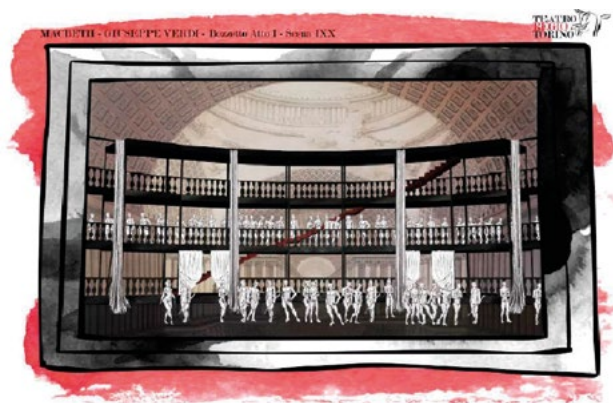
Macbeth, bozzetto Atto I Scena IX.

Nella mostra è stato dunque possibile ammirare i progetti veri e propri, con annesso il loro materiale comprensivo di tavole, campioni di scene, bozzetti e plastici, potenzialmente pronti per una messa in scena. I progetti sono risultati molto dissimili l'uno dall'altro, frutto della creatività di giovani e fantasiosi studenti, che si sono accostati con entusiasmo e impensabile competenza al mondo fatato e magico della lirica, al quale erano, come detto, fundamentalmente estranei.