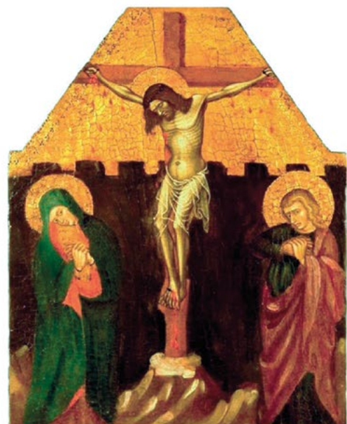
Crucifixione con Santi - Maestro Incisa di Scapaccino - Olio su tavola Opera sottratta dalla Chiesa della Beata Vergine del Carmine e recuperata dal Nucleo Carabinieri TPC di Torino nel 2008