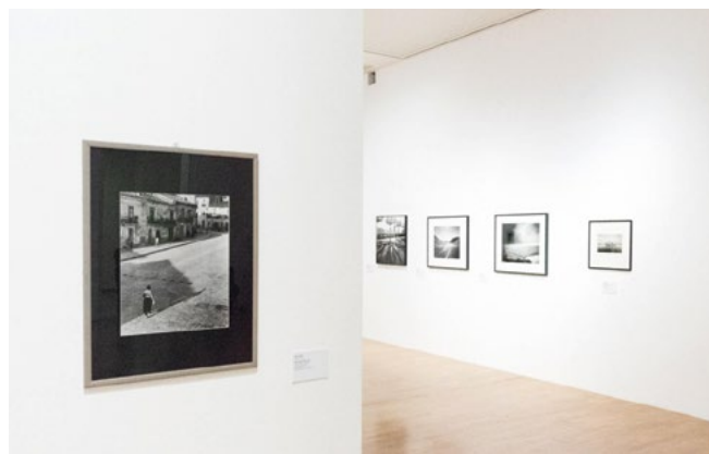
GAM, Suggestioni d'Italia.