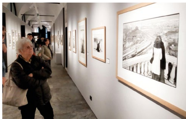
Forte di Bard, Landscapes/Paysages.