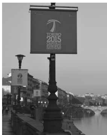
Stendardi in PVC di «Torino 2015»

Nel dicembre del 2015, dopo la cerimonia di chiusura dell'evento, Torino ha dismesso tutto