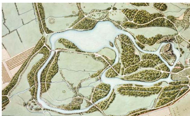
Figg. 2-3. Confronto tra un dettaglio del Piano geometrico del 1839 e un'immagine satellitare odierna: l'area centrale del parco, costituita dalle tre isole, è habitat ideale per avifauna e altre numerose specie di animali. Le profonde differenze nella consistenza della vegetazione potranno essere appianate soltanto gradualmente, grazie a interventi puntuali, programmati nel tempo e non invasivi per l'ecosistema e le specie che vi vivono.