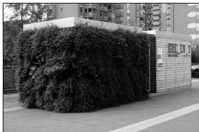
Figure 1 - Modular installation located in Environment Park, Turin (I)

The monitored performances focused on: surface temperatures and heat flows in summer and winter; the sound absorption coefficient; the dilution of TVOC (Total Volatile Organic Compound); the LAI (Leaf Area Index), used in the correlation between energy and