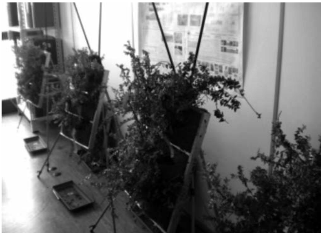
Figure 3 - GRE_EN_S modular boxes during the monitoring in office room

Based on results expected focused indicators could be developed consistently to available economic assessment methods.