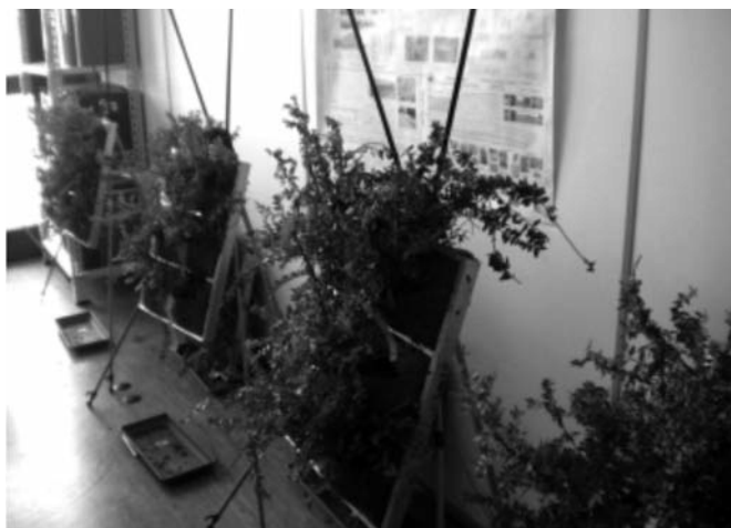
Figura 3 - Moduli GRE_EN_S in fase di monitoraggio in locali ad uso ufficio

I monitoraggi sono stati effettuati con sensori in grado di misurare i composti organici volatili totali (TVOC), espressi in parti per milione (ppm).