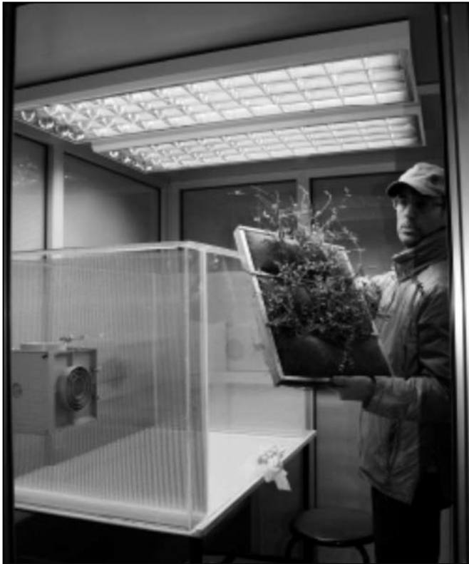
Figure 2 - GRE_EN_S modular boxes during the monitoring in test cell