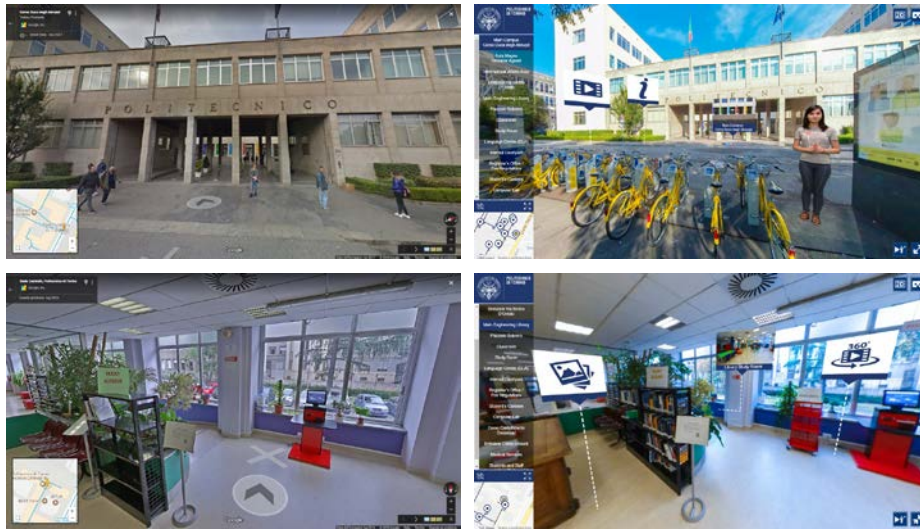
Fig. 5. PoliTour 360° - Confronto fra StreetView (a sinistra) e i video 360° del PoliTour (a destra)

Street View è un ottimo strumento per navigare gli ambienti grazie alla grande quantità di materiale fotografico e multimediale di cui è fornito ma non è paragonabile all'esperienza che può essere fornita da un tour virtuale guidato, arricchito di contenuti e di modalità di navigazione intuitivi in grado di coinvolgere ed evitare quel senso di disagio e di smarrimento che l'utente potrebbe sperimentare visitando nuovi luoghi.