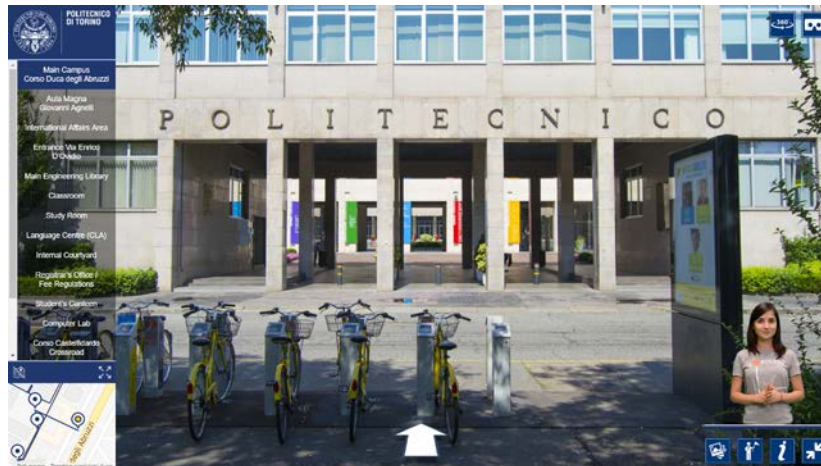
Fig. 1. PoliTour 2D - Punto di partenza del tour.