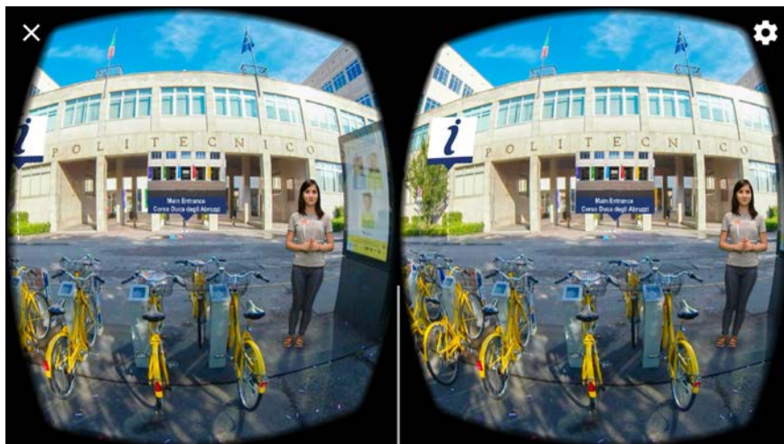
Fig. 4. PoliTour VR - Punto di partenza del tour. Visualizzazione stereoscopica.