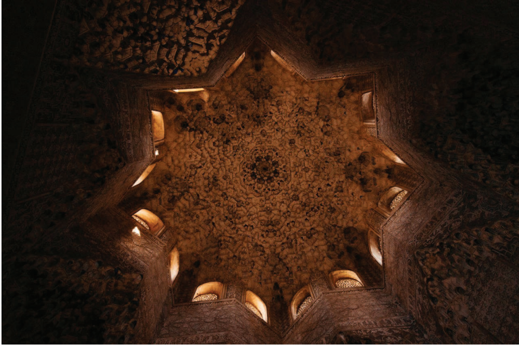
Ilustración 5. Cúpula de base estrellada sobre la Sala de Abencerrajes en la Alhambra.