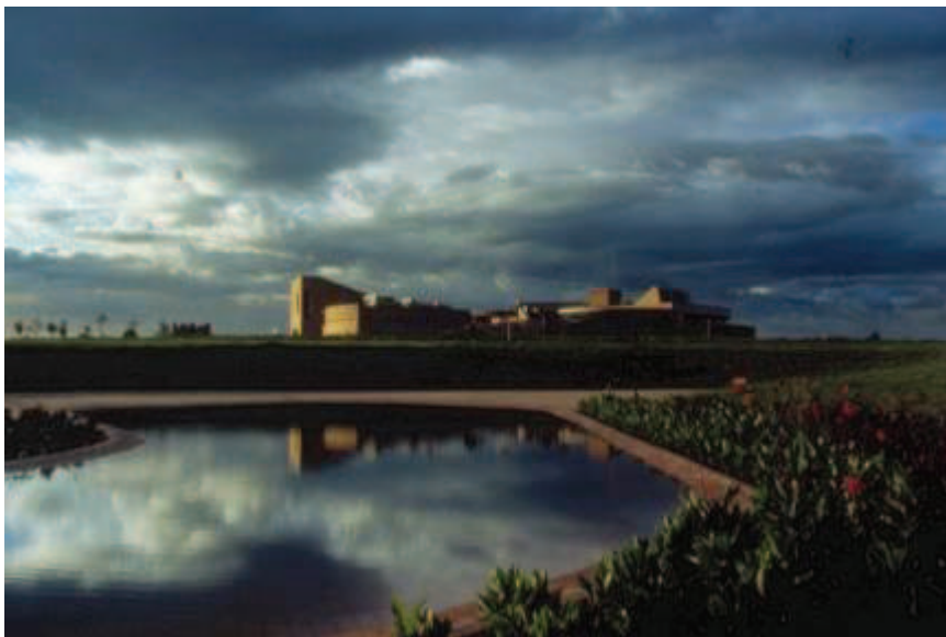
Ilustración 4. Biblioteca Virgilio Barco.

Fuente: Fotografía original de Rogelio Salmona (Fundación Rogelio Salmona).