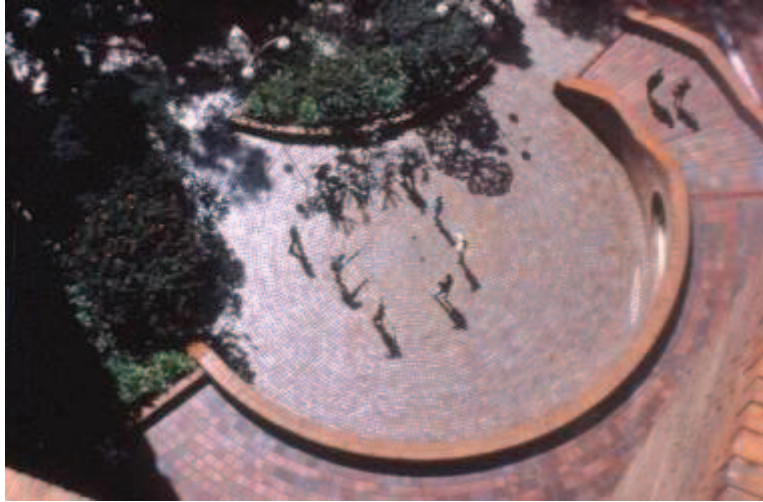
Ilustración 2. Plaza entre las Torres del Parque.