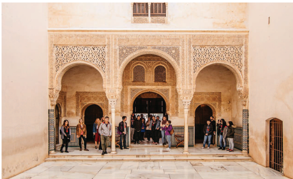
Ilustración 1. Patio de acceso del Palacio de Comares.

El universo de este arquitecto recoge influencias y contribuciones tanto notables como anónimas, locales y foráneas, populares y refinadas. Su obra está desbordada de mestizajes. La Alhambra se hace presente no solo en la evidencia de esa mezcla de culturas distintas, sino también en la invención de una nueva a través de esa licencia. En su ciudad bogotana Salmona incorporará, años después, algunos de los indicios conservados desde esa primera visita a Granada de los años 50 y lo hará de forma que sin arrasar con lo precedente o lo contemporáneo creará arquitecturas tolerantes, cultas y disímiles que nos recuerdan este origen excepcional. Sucede especialmente sobre el espacio público de sus proyectos, -recordando la función contemplativa de los “salidizos” de La Alhambra en plazas, patios, escaleras, caminos y terrazas, donde tiene lugar el encuentro de todo tipo de diferencias mientras se divisa la ciudad a lo lejos.