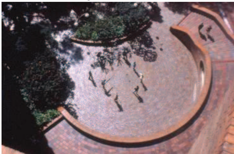
Ilustración 2. Plaza entre las Torres del Parque.