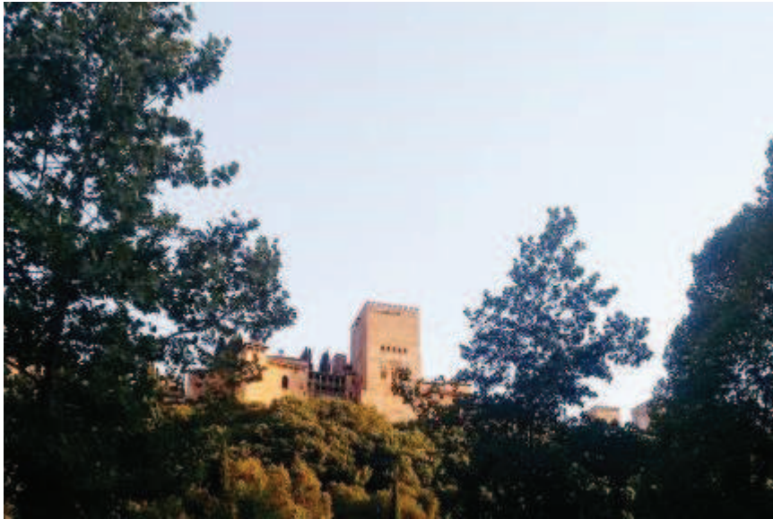
Ilustración 3. Torre del Palacio de Comares en la Alhambra.