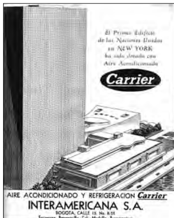
Figura 14. Publicidad de aire acondicionado y refrigeración Carrier, importado por Interamericana S. A. Proa 35 (mayo de 1950)

31 Título del artículo de Alison y Peter Smithson publicado en la revista finlandesa Ark , en 1956, que coincide con la construcción de la Casa del Futuro. Hace referencia a la visión de los Smithson de los años cincuenta como un periodo dominado por la publicidad, por los nacientes mass media , los cuales basan gran parte de su mensaje en lo visual y lo publicitario.