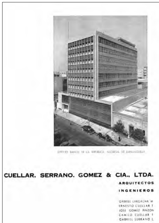
Figura 9. Publicidad de Cuéllar, Serrano, Gómez y Cía. Proa 64, octubre de 1952

Estas empresas aparecen regularmente a lo largo de la década corta. Al comparar este dato con la tabla de tarifas para anunciantes, se puede inferir que optaban por la opción de pago de más de doce inserciones (la más costosa de las ofrecidas por Proa ), y que seguramente la renovaban al completarse este plazo. No en vano son aquellas empresas que tuvieron un mayor impacto en el sector constructivo del país. Ejemplo de ello es Cuéllar Serrano Gómez, la firma de arquitectos más anunciada en la revista, autora además de un importante número de obras arquitectónicas publicadas en ella durante la década. Se habla de empresas muy comprometidas con la construcción de la modernidad en Colombia, las cuales hacen de Proa su escaparate, se publicitan, se publican, se hacen públicas .