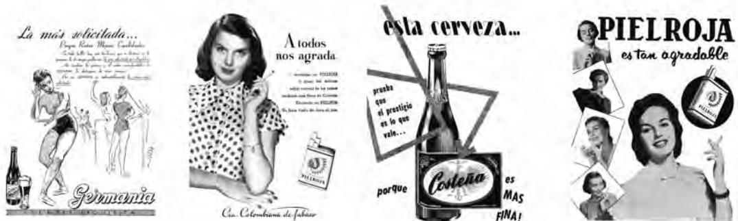
Figura 13. Recopilación de anuncios en formato de un cuarto de página. De izquierda a derecha: Cerveza Germania (Proa 65), Tabacos Pielroja (Proa 67, enero de 1953), Cerveza Costeña (Proa 78, enero de 1954) y nuevamente Tabacos Pielroja (Proa 80, mayo de 1954)

Por último, este formato era utilizado muy a menudo por empresas no relacionadas directamente con el gremio de la construcción o con el ámbito doméstico. Productos como tabaco, bebidas y comestibles, todos asociados a la imagen del arquitecto como personaje público (fig. 13). Su presencia en la revista es interesante como elemento indisoluble del imaginario colectivo, donde el arquitecto se muestra de cara a la sociedad como encargado de la “misión moderna”.