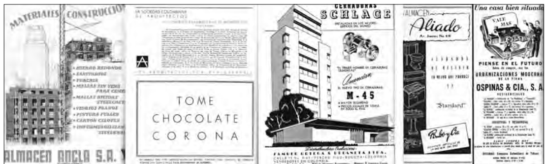
Figura 2. Diversas publicidades de la revista Proa . De izquierda a derecha: Almacén Ancla ( Proa 31, enero de 1950), SCA y Chocolate Corona ( Proa 32, febrero de 1950), Cerraduras Schlage ( Proa 32, febrero de 1950), Almacén Aliado y Urbanizaciones Ospina y Cía. S. A. ( Proa 34, abril de 1950)