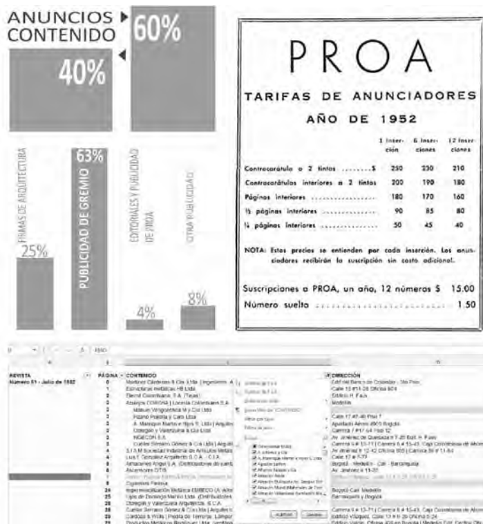
Figura 8. Izq. Datos de porcentajes de contenido/anuncios de las revistas inventariadas, junto con la distribución de los tipos de empresas representadas. Der. Tabla de tarifas para anunciantes. Proa 66, diciembre de 1952. Abajo: muestra de la tabla de inventariado utilizada durante la investigación

De este modo, diagramación y anunciante estaban directamente relacionados entre sí, haciendo público un mayor o menor compromiso con la revista. De acuerdo con esto, se han distinguido cuatro categorías de anuncios según su diagramación, relacionadas a su vez con cuatro familias de anunciantes: las grandes empresas aliadas con Proa ; las oficinas de arquitectura, ingenieros y constructores; los proveedores de tecnología para el hogar, y, por último, las marcas de productos diversos como comestibles, tabaco, cerveza, etc.