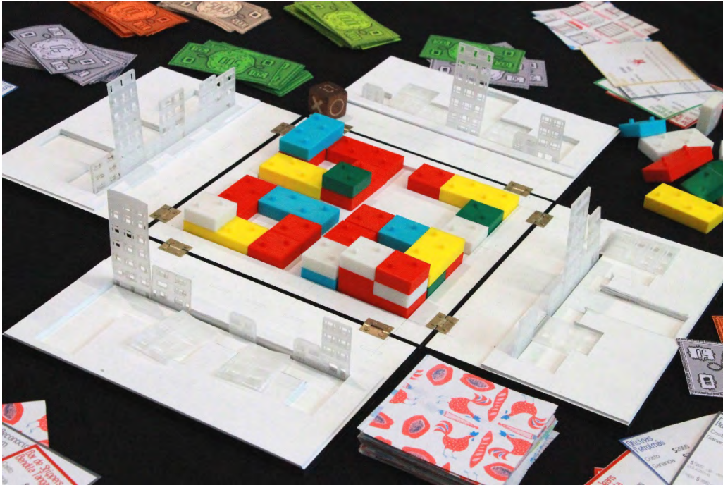
Figura 4: Dudópolis, prototipo análogo desarrollado por los estudiantes de DigitalScapes 2018.

de estos resultados también se desarrolló el prototipo análogo “Dudópolis”, en el que se exploraron dinámicas jugables para el debate sobre la corrupción en contextos urbanos y sus efectos sobre el entorno [Fig. 4].