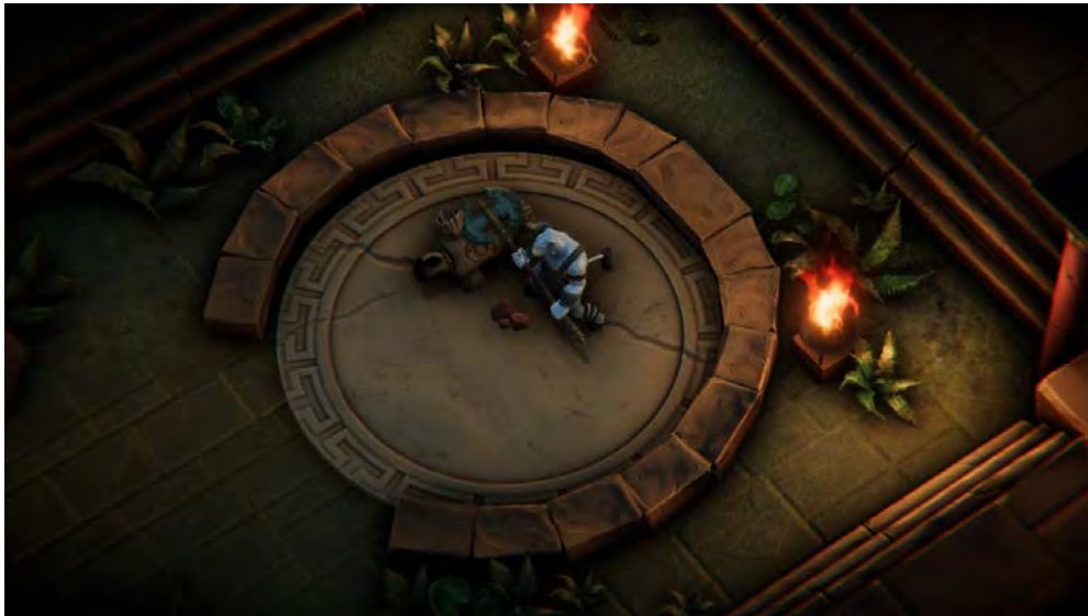
Figura 3. Captura de Asterion, en proceso de desarrollo por los estudiantes egresados del semillero DigitalScapes que conformaron la desarrolladora GlassBear Studio 2018.

Durante el semestre 2017-2 se comenzó a trabajar la representación de la ciudad latinoamericana en el videojuego, prestando especial atención a la dramatización de estereotipos. Durante este periodo se experimentó con el registro de juego mediante capturas de pantalla, que posteriormente eran seleccionadas y clasificadas según conceptos discutidos en grupo. Uno de los resultados fue el hallazgo de cinco estereotipos principales de ciudades latinoamericanas en el videojuego: La ciudad precolumbina mesoamericana, la ciudad colonial española en el sur de estados unidos, la ciudad colonial caribeña, la metrópoli andina contemporánea y la barriada informal.