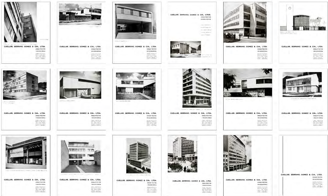
Ilustración 4: Publicidades de Cuéllar, Serrano, Gómez & Cía en revista Proa. Proa, Colombia, 1946-1963.