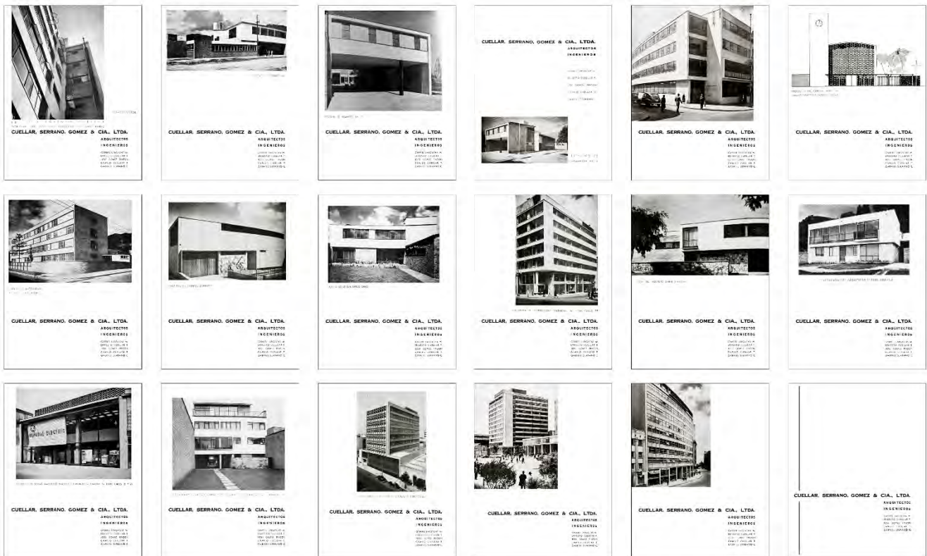
Ilustración 4: Publicidades de Cúellar, Serrano, Gómez & Cía en revista Proa. Proa, Colombia, 1946-1963.