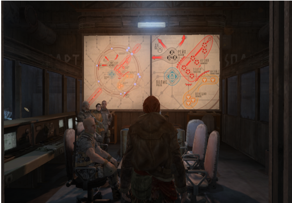
Fuente: Captura de videojuego Metro Last Light.

La práctica de destacar un trazado, caracterizarlo y darle nombre, se repite en el segundo elemento fundacional de Metro 2033: la línea.