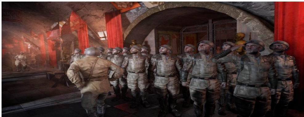
FIGURA 4. SOLDADOS EN UNA DE LA ESTACIONES DE LA LÍNEA ROJA. METRO LAST LIGHT REDUX (A4 GAMES, 2015B)