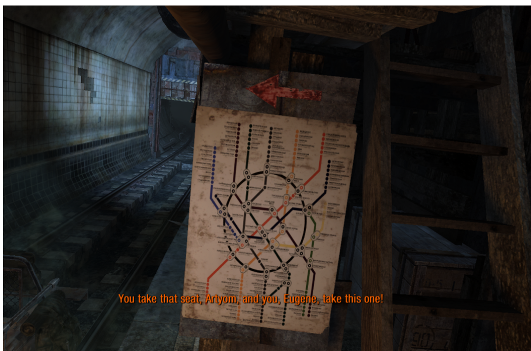
FIGURA 2. CAPTURA DE METRO 2033 EN LA QUE APARECE EL PLANO DEL METRO EN PRIMER PLANO. METRO 2033 REDUX (A4 GAMES, 2015A)