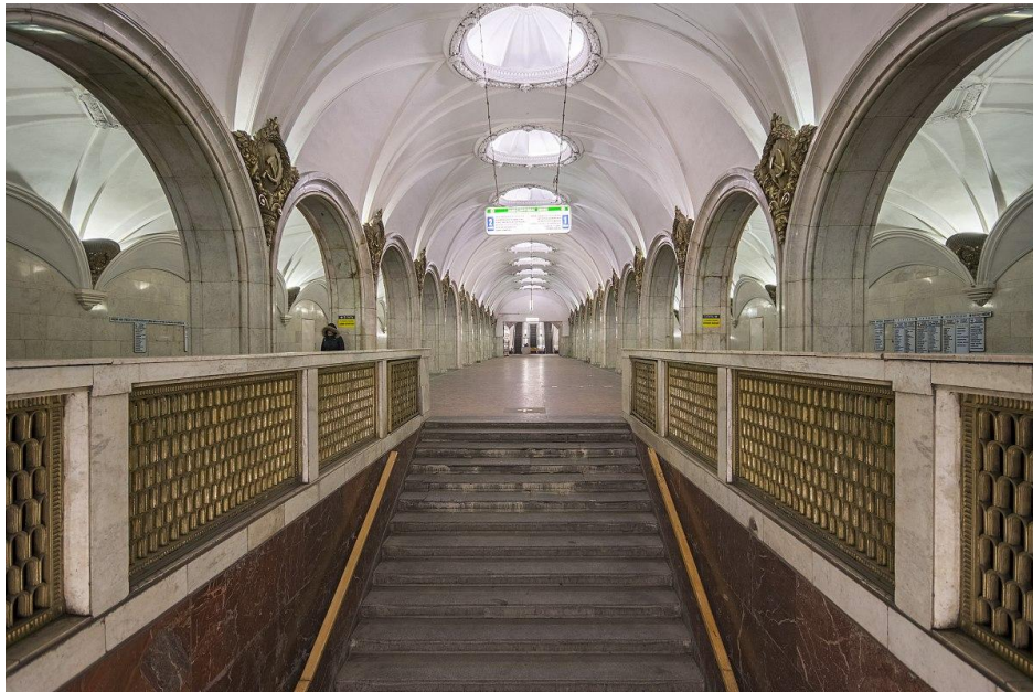
FIGURA 9. ESTACIÓN PAVELETSKAYA EN EL SISTEMA METRO DE MOSCÚ