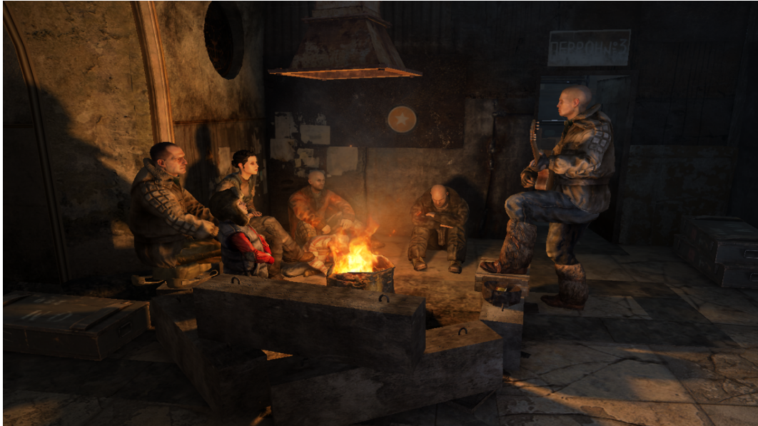
FIGURA 5. CANCIÓN ALREDEDOR DEL FUEGO. METRO 2033. REDUX, A4 GAMES 2015