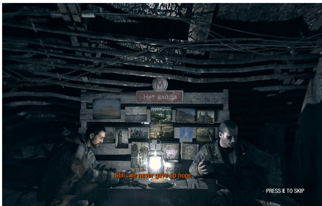
FIGURA 1. MERCADO DE POSTALES EN LA ESTACIÓN VDNH - CENTRO PANRUSO DE EXPOSICIONES. METRO 2033 REDUX, (A4 GAMES, 2015A)