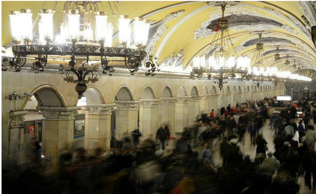
FIGURA 7. BIBLIOTEKA IM. LENINA