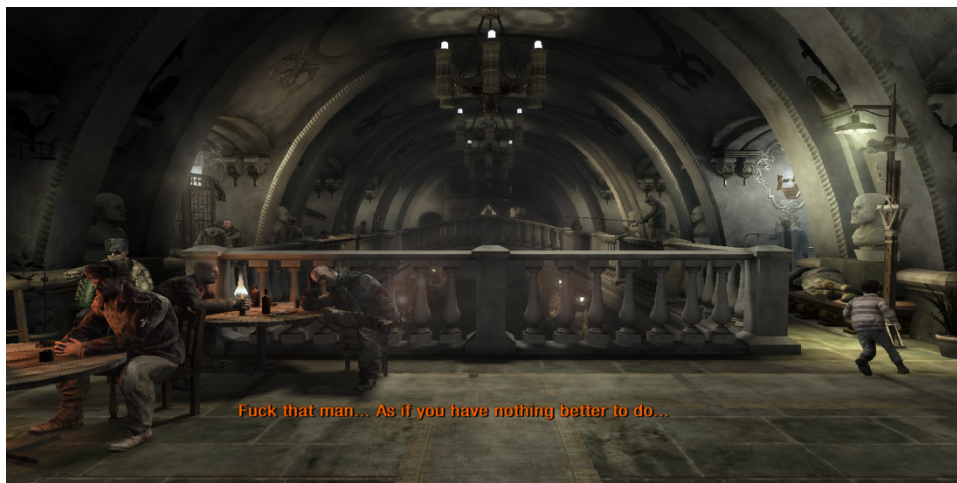
FIGURA 6. POLIS, METRO 2033 REDUX (A4 GAMES, 2015A)