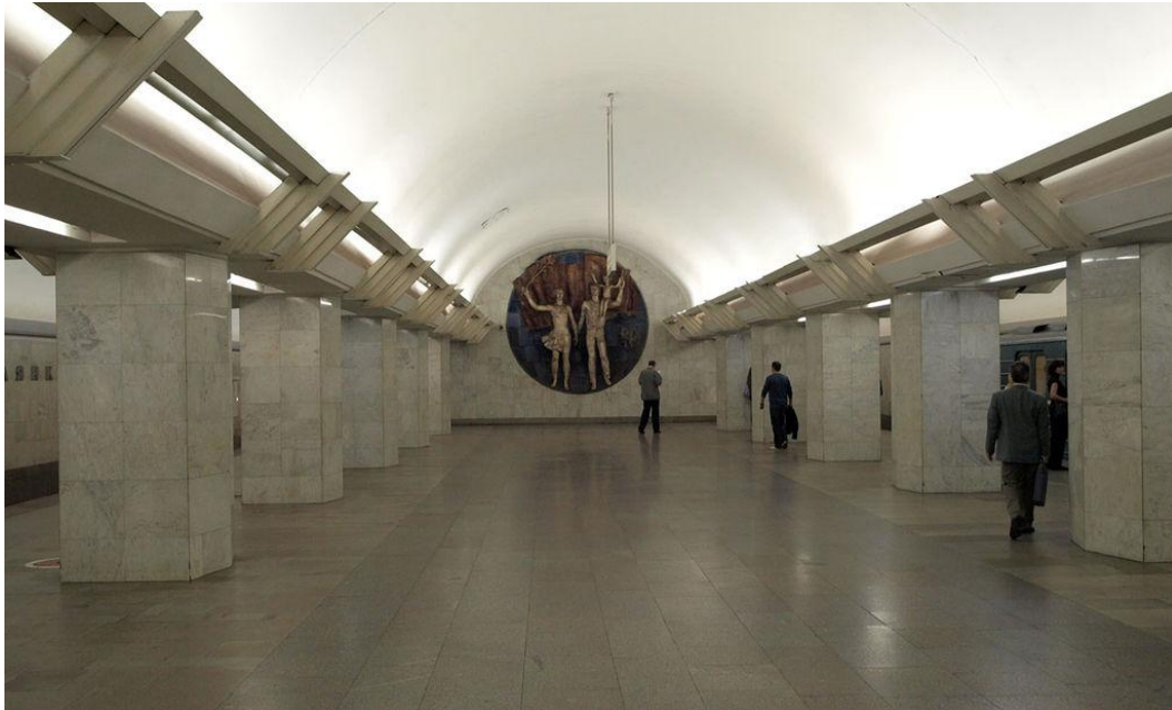
FIGURA 8. ESTACIÓN PALLYANKA EN LA ACTUALIDAD