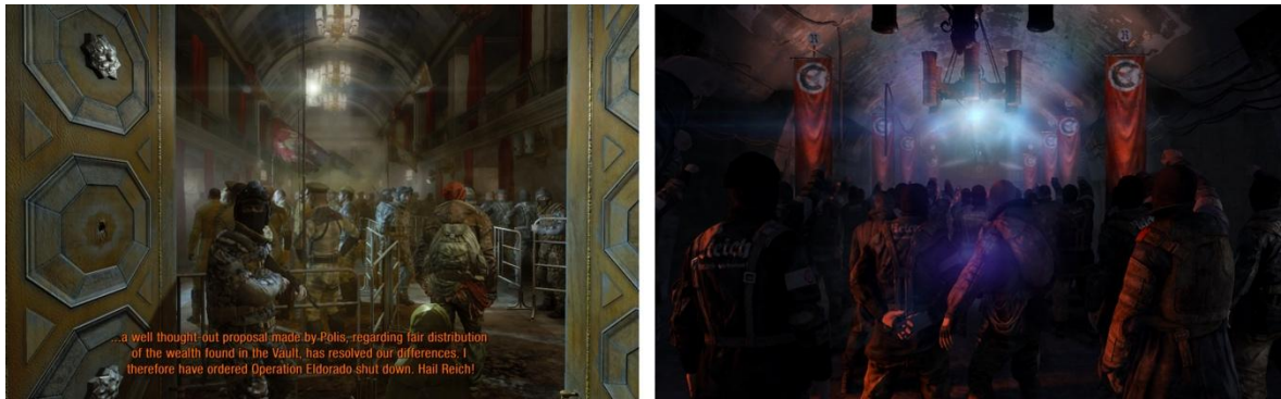
FIGURA 10. CONTRASTE ENTRE DOS ESTACIONES DE AGRUPACIONES POLÍTICAS OPUESTAS. METRO LAST LIGHT REDUX, 4A GAMES (2015)