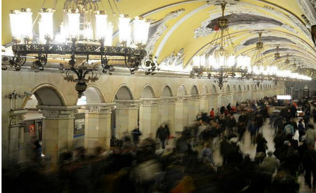
FIGURA 7. BIBLIOTEKA IM. LENINA