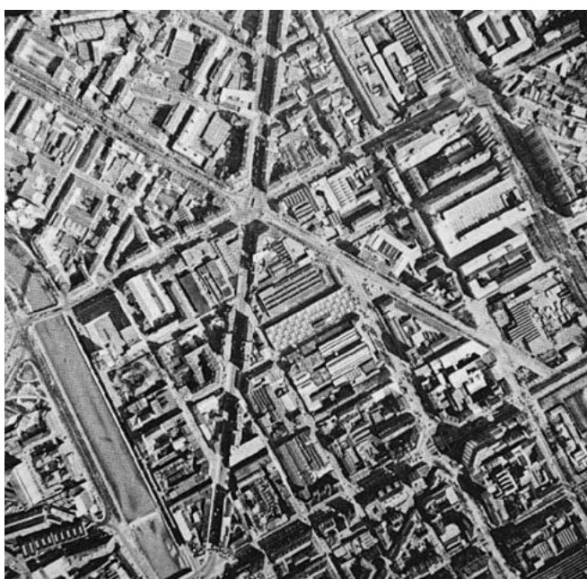
«Schema urbanistico stellare del settore nord della città tra la cinta daziaria del 1853 e la Dora. (Fotografia aerea zenitale, 1979)» in Torino, p. 213.