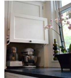
Hinged cabinet. Love this to hide appliances