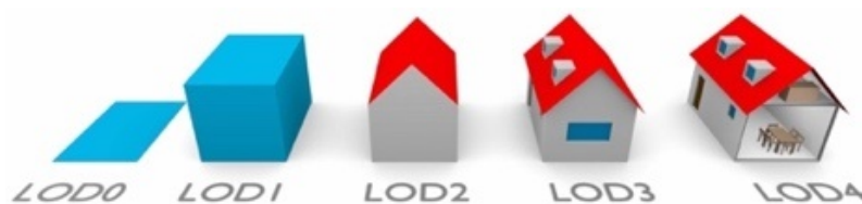
Figura 1. Definizione dei livelli di dettaglio in CityGML

Al fine di garantire un'interoperabilità efficace dell'EID sono stati selezionati due formati standard per i dati cartografici: INSPIRE (obbligatorio per il 2020 in Europa) e CityGML (Costamagna, Spanò, 2013). Il modello di dati INSPIRE è stato utilizzato per ottenere un'informazione spaziale armonizzata come riferimento per le politiche e le attività comunitarie che possono avere un impatto sull'ambiente. Per questo motivo, le diverse entità correlate al rischio, al pericolo e alla necessità di proteggere sono state estratte dal modello di dati INSPIRE.