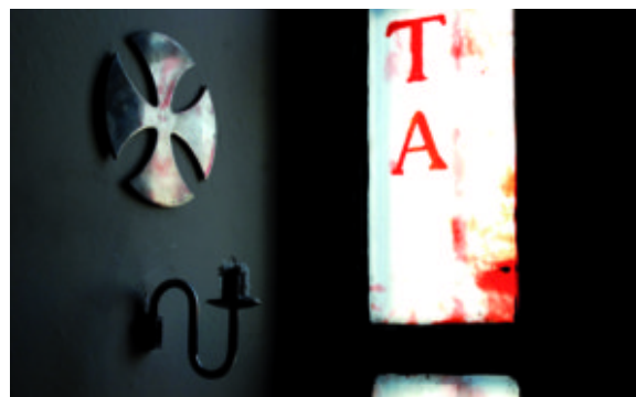
La cura del dettaglio: croce per la dedicazione dei Santi Nazaro e Celso a Prospiano, Gorla Minore (Enrico Castiglioni, 1965)

Si tratta di patrimoni immensi dal punto di vista della memoria, dell'immaginario collettivo, dell'autorappresentazione, ma anche di patrimoni immobiliari costosi da mantenere, e di processi