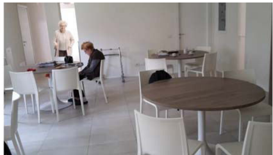
Figura 2. Residenza a Pradalunga: soggiorno e sala da pranzo.