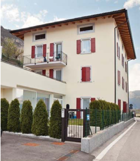
Figura 1. Casa alla vela a Trento.

Mini alloggi protetti della Fondazione Giuseppe Restelli onlus a Rho (MI) si configurano come un condominio con ingresso su strada, secondo una tipologia a tre piani a ballatoio su cui si affacciano alloggi monocali e di 2 o 3 camere. Gli alloggi sono collegati con la RSA adiacente tramite un corridoio al piano terra. Gli ospiti usufruiscono di un servizio sorveglianza-infermieristico a chiamata e una visita del personale al mattino e a sera. Possono usufruire dei servizi di ristorazione e degli spazi comuni della RSA.