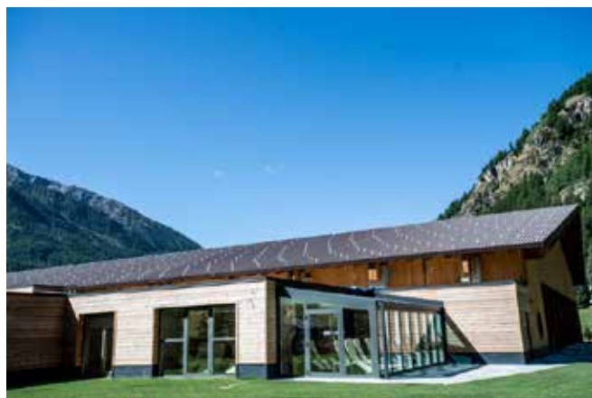
A sinistra: uno dei nuovi volumi sul fronte est, che esce dalla sagoma del precedente palazzetto; a destra e una foto del raccordo volumetrico tra i due fronti sud ed est.