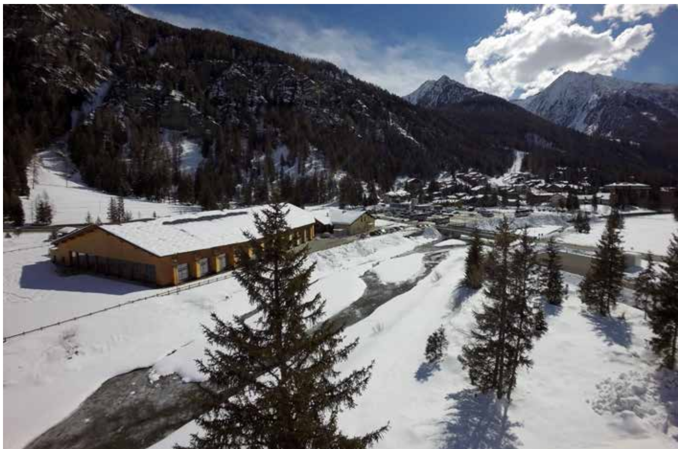
Il palazzetto dello sport di Champoluc rifunzionalizzato in centro balneoludico. L'iter del progetto è iniziato nel 2012, con l'aggiudicazione del concorso all'architetto F. Bianchetti con Architettura Tre.

carattere di decoro urbano era proprio funzionale a testimoniare la “civilizzazione” in corso, secondo i codici interpretativi di allora.