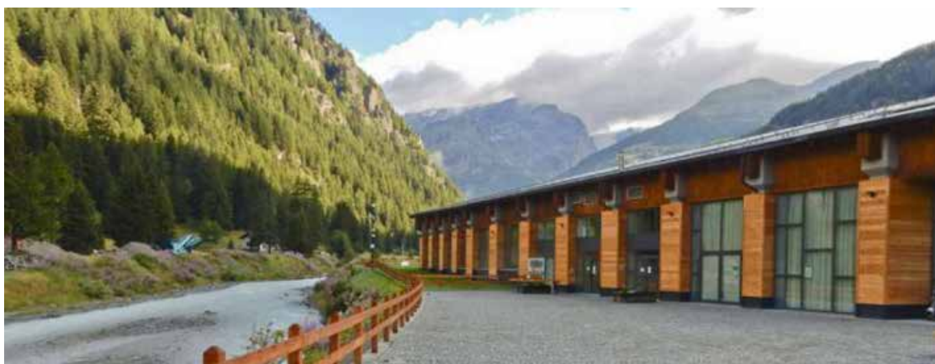
Il prospetto sul fronte verso il torrente Evançon. È riconoscibile il ritmo della struttura originaria, costituita da pilastri in calcestruzzo e travi in legno lamellare.

ricondursi al significato di sistema territoriale, per favorire il processo di attrazione cumulativa che la rete stessa favorisce, in relazione ai flussi di ricettività.