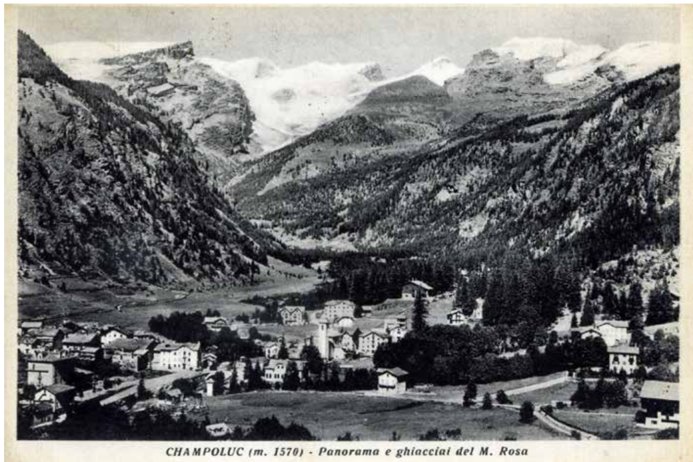
CHAMPOLUC (m. 1570) - Panorama e ghiacciai del M. Rosa

Champoluc in una cartolina d'epoca degli anni cinquanta del Novecento. Al centro il pianoro in cui è stato realizzato il Palazzetto dello sport.