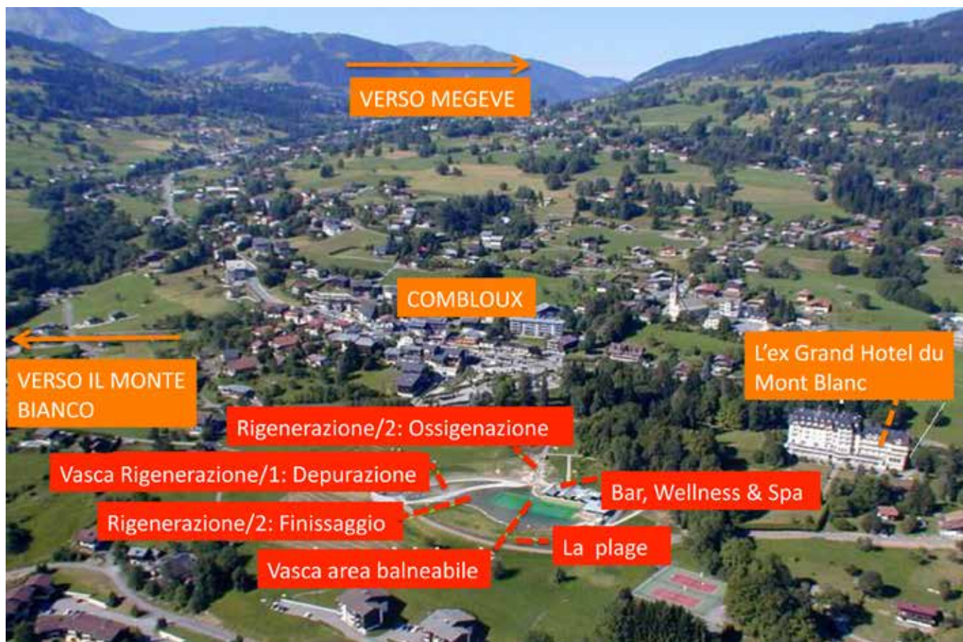
Vista d'insieme sul Plan Perret nel suo contesto territoriale.

ma di piani rimodellati e vegetati ex-novo sulle terrazze naturali (aree tematiche per le bocce e il gioco dei bambini) – che si aprono sulla scalinata centrale: percorrendola in discesa, il punto di arrivo è un belvedere che si affaccia sul Plan Perret, ora ribattezzato in Plan d'Eau Biotope proprio perché su quella terrazza naturale è stata costruita la biopiscina.