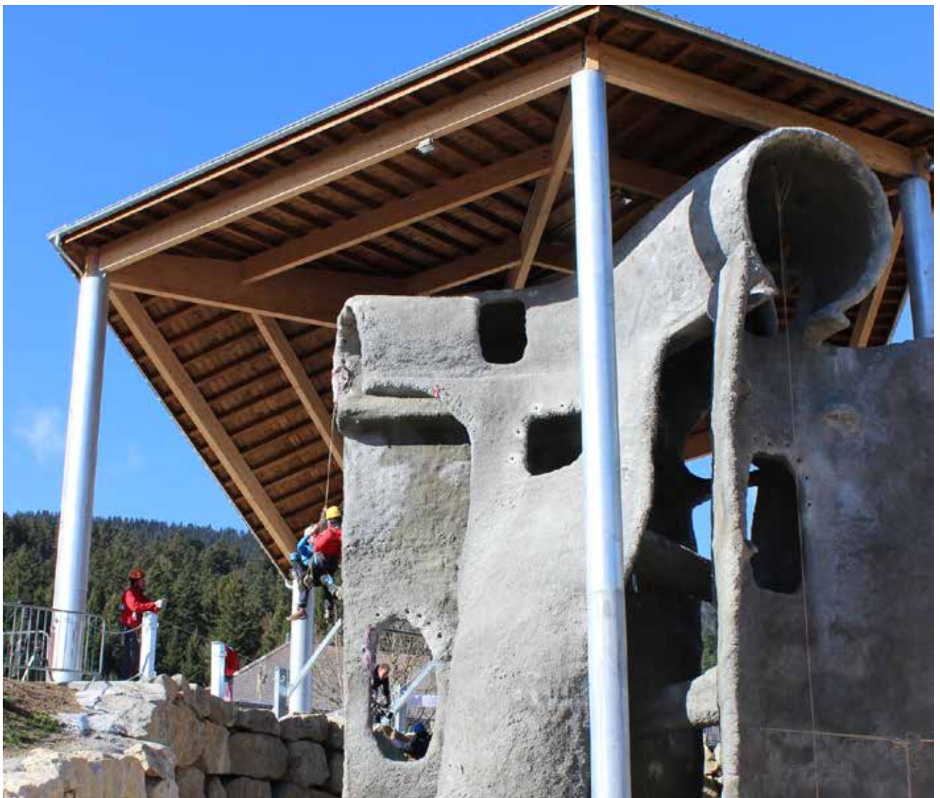
Speleologi in ambiente outdoor.

Alessandro Mazzotta, 2018, pp. 40dx, 41.