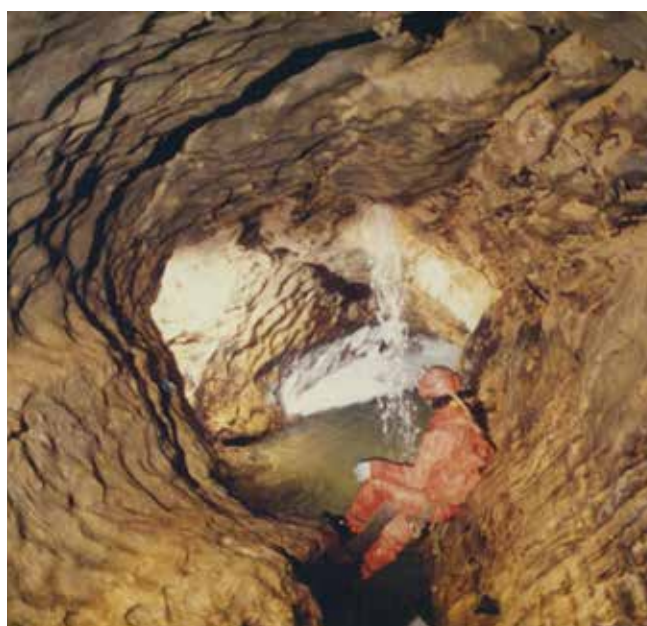
Acqua e roccia nel sottosuolo: il canale-sifone Vernacé.