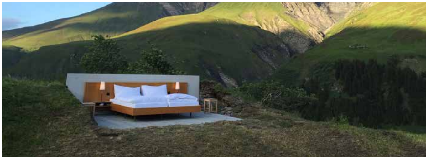
Null Stern Hotel, 1960 m, Safiental, Cantone Grigioni (CH), (©Atelier für Sonderaufgaben)

Margherita Valcanover IAM - Politecnico di Torino