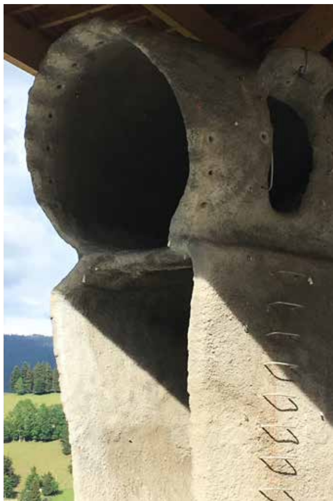
Dettaglio "torre" e gli elementi di appoggio.

aziendali (tra le quali, l'IBM) e, ancora successivamente, village-station anche per gli sport invernali.