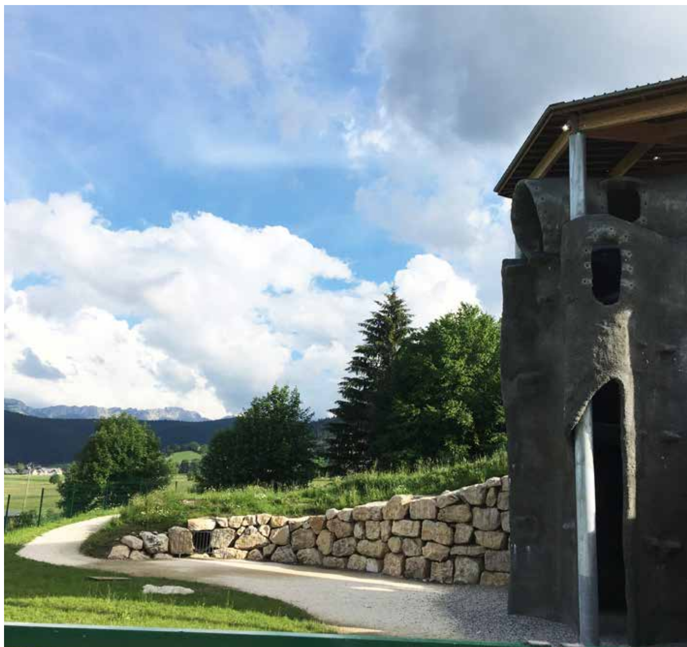
Vista dal fronte ovest.

Proprio nei pressi di Méaudre è localizzato un punto di accesso al più esteso – 33 km nel sottosuolo tra Méaudre stesso e la Val d'Autrans – di questi paesaggi sotterranei sonori e tattili del Vercors stesso, ovvero le Trou qui souffle .