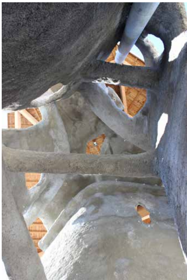
Lo Spéléo artificielle di Méaudre: vista dall'interno.