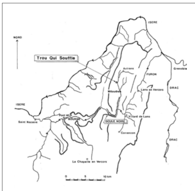
Il sistema delle gallerie sotterranee e l'ingresso dal Trou qui soufflé.

Méaudre è il villaggio che si è posto come caposaldo territoriale – per la verità, nel connubio Autrans-Méaudre – a uno dei più ampi di questi pianori. Si tratta di un nucleo abitato che condivide la storia di altre località simili: borgo contadino che si apre timidamente al turismo d'élite estivo, poi luogo prescelto delle colonie