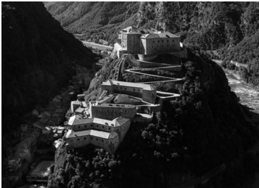
Fig. 1. Le relazioni territoriali tra il baluardo roccioso su cui si erge il nuovo Forte di Bard nel progetto del colonnello Olivero e il borgo omonimo appaiono evidenti nella veduta dall'alto. Da parte opposta, fuori dall'immagine, si colloca, a scavalco del corso della Dora Baltea, il ponte, più antico, di Jacquemet.